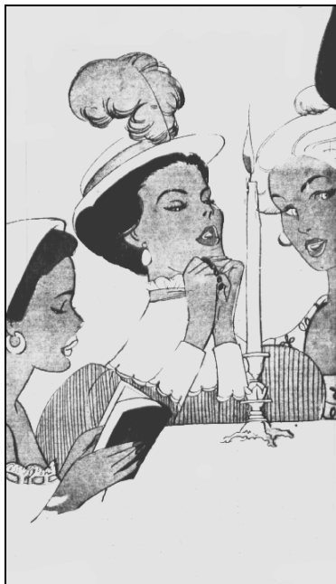
desenho de Alceu Pena texto de A. Ladino

- Nos bailes como isca, de noite e de dia, a gente se arrisca a ficar titia