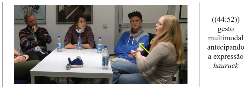
Figura 2: gesto multimodal – hauruck

Por fim, na linha 14, A5 executa um último gesto, no qual ela empurra as palmas das mãos abertas verticalmente, indo da parte superior do corpo para fora, ao se referir, no nível verbal, aos alemães ‘distantes’. Com isso, em um primeiro passo, ela se refere metonimicamente a uma linha fronteira demarcando um território que outros não podem ultrapassar, e que, em um segundo passo, representa metaforicamente a atitude distante dos alemães. Novamente, especialmente pelo uso do gesto metafórico, tornam-se reveladas a posição do observador e a experiência de ‘alteridade’ a partir de um posicionamento reflexivo ao comparar as duas culturas, o que implica o próprio comportamento descrito agora a partir de um ângulo retrospectivo.