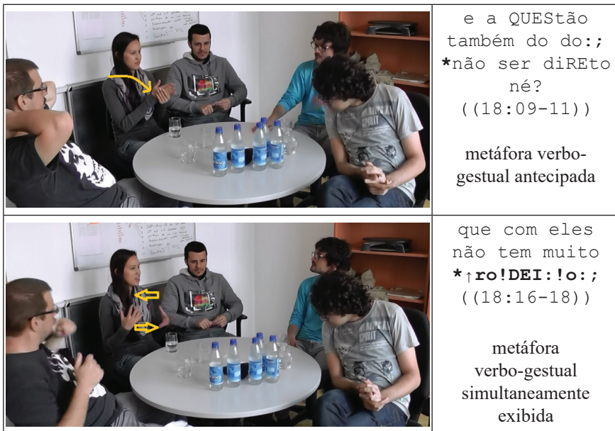
Figura 3: metáfora verbo-gestual – alemães diretos e brasileiros indiretos

como conceito-chave cultural, a palavra direto é enfatizada prosodicamente pelo acento, e também verbalmente pelo anúncio metacomunicativo na linha 02 e a QUESTão também do , que age como pista de contextualização ao reativar a metáfora. O significado original de direto , ‘em linha reta, reto; numa determinada direção, sem desvios’ (HOUAISS et al., 2009, p. 691), é ampliado de forma não verbal: a mão direita desenha uma linha reta que vai de encontro à mão esquerda, exprimindo clareza e objetividade. Em uma segunda etapa, B2 desenvolve a metáfora ao esquematizar então a atitude oposta para atribuir aos brasileiros a característica contrária: não tem muito ro!DEI:!o . Aqui a metáfora é elaborada coexpressivamente no nível gestual pelas mãos se movendo em círculos. Os dois esquemas estão interligados e ancorados corporalmente, como destaca Johnson (2005, p. 20): “Nós experimentamos e inferimos algo sobre MOVIMENTO RETILÍNEO [...] e inferimos algo diferente sobre movimentos curvilíneos ou desviados que não têm destino óbvio (relativo a um esquema FONTE-CAMINHO-ALVO).” 14 Lakoff (1987, p. 269-303) destaca que a DIREÇÃO apresenta a constituinte básica para o esquema CAMINHO e demonstra de que forma este esquema serve como base para metáforas através das quais FINALIDADES são concebidas em termos de DESTINOS.