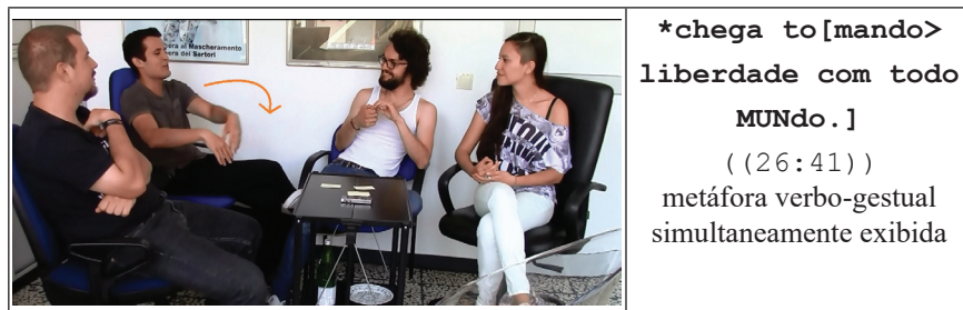
Figura 1: metáfora verbo-gestual – os brasileiros invasivos

À primeira vista, pode-se descrever esta metáfora de acordo com Müller e Cienki (2009) como uma ‘verbo-gestural metaphor’, uma vez que se observa claramente um interjogo da metáfora territorial em ambos os níveis. Não obstante, um olhar mais próximo revela que a metáfora gestual é muito mais complexa por transformar a ideia esquemática do ‘tomar espaço’ em uma invasão por ser vivo (KÖVECSES, 2005, p. 68; GRADY, 2005, 1608-1609). Adicionalmente, pode-se confirmar a hipótese de Mittelberg e Waugh, pois os movimentos gestuais esquemáticos apontam metonimicamente para o ataque como um todo, que, como segundo passo de inferência, é metaforicamente projetado para o comportamento dos brasileiros.