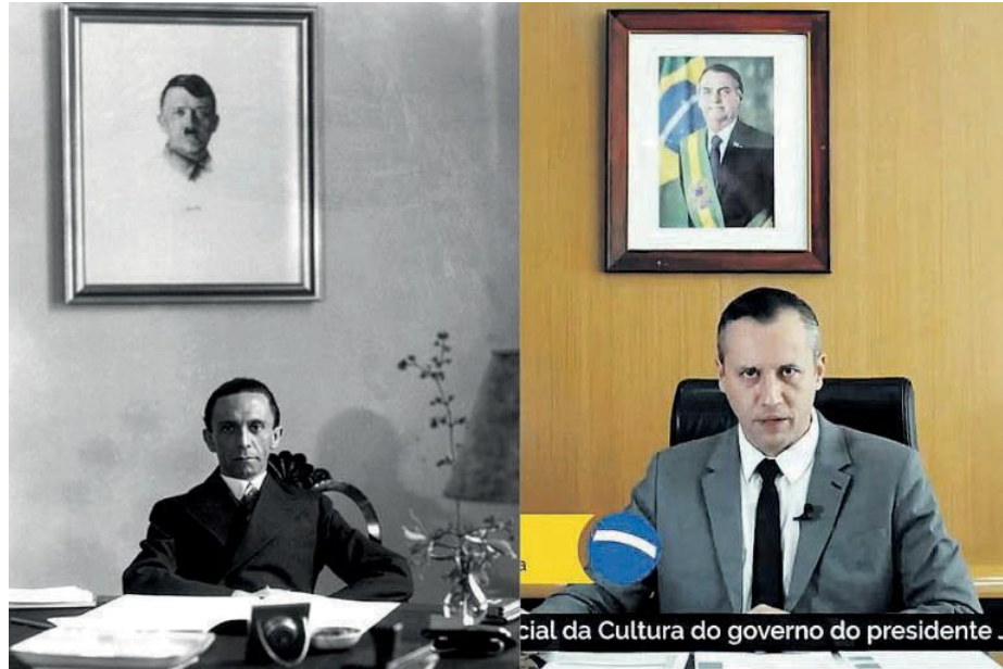
Figura 4 - Montagem com retrato de Goebbels e do ex-secretário de Cultura Roberto Alvim.

A arte alemã da próxima década será heroica, será ferreamente romântica, será objetiva e livre de sentimentalismo, com grande páthos e igualmente imperativa e vinculante, ou então não será nada. (BARROS, 2020)