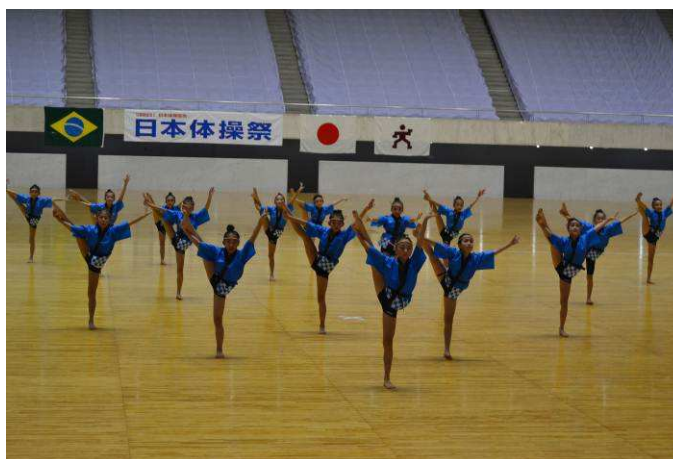
Figura 1 – Crianças apresentando-se no festival.

Na edição de 2013, objeto dessa análise, participaram 140 grupos, sendo apenas dois estrangeiros (um de Hong Kong e outro do Brasil), os quais foram convidados para esta performance. Um total de 5.500 ginastas se apresentaram nas 124 coreografias, sendo 46 no primeiro dia e 78 no segundo. O público espectador foi em torno de 4.000 pessoas considerando os dois dias de apresentação e a entrada foi paga. De fato, a participação de grupos estrangeiros, normalmente apenas um, é uma das mudanças ocorridas nas últimas edições conforme destaca a Associação Japonesa de Ginástica. Em 2013 o Brasil foi o país convidado, representado pelo GGU. Por ocasião de uma visita especial, também foi incluída a participação de um grupo de crianças de Hong Kong.