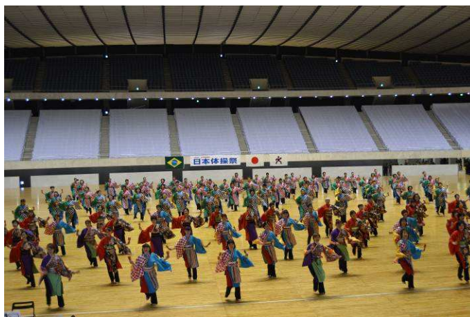
Figura 7 – Coreografia de Ginástica Feminina.