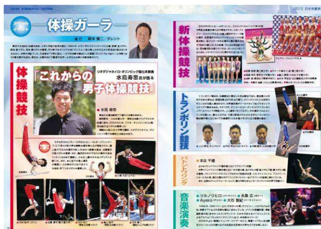
Figura 3 – Destaque das apresentações de Gala.

Durante os intervalos das apresentações, momento de entrada e saída do público, foi possível observarmos apresentações de ginástica de alto rendimento, como os campeões japoneses e olímpicos de trampolim acrobático sincronizado, as campeãs japonesas de ginástica rítmica, além de atrações diversas (música ao vivo; baston twirling), que conformam o programa de “Gala” do festival.