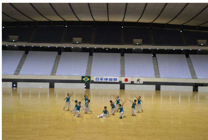
Figura 8 – Ginástica Feminina.

Por outro lado, ao analisarmos os figurinos e acessórios utilizados pelos grupos, vimos que os acessórios estavam presentes em doze grupos (27,9%), constituindo principalmente laços e lenços no cabelo e plumas no pescoço. Já muitos dos figurinos das coreografias eram semelhantes aos utilizados na GR e outros típicos da dança, nesse caso bastante trabalhados. De modo geral, os figurinos eram simples, como bermudas pretas e camisetas coloridas. Poucos demonstraram maior requinte, e não foi observado o uso de maquiagem temática ou especial.