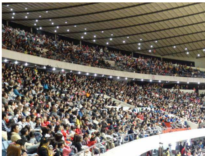
Figura 2 – Público durante a apresentação do GGU.

Os grupos que desejam integrar-se a delegação japonesa que participará da WG devem apresentar-se no festival em algumas de as suas edições anteriores, por exemplo, para a participação na edição de 2015, precisam estar presentes no festival nacional de 2011, 2012, 2013 e 2014. Caso isso não ocorra, o grupo não pode inscrever-se para a WG. Desse modo, a organização garante a participação de diversos grupos em seu festival nacional bem como um acompanhamento regular de suas produções coreográficas.