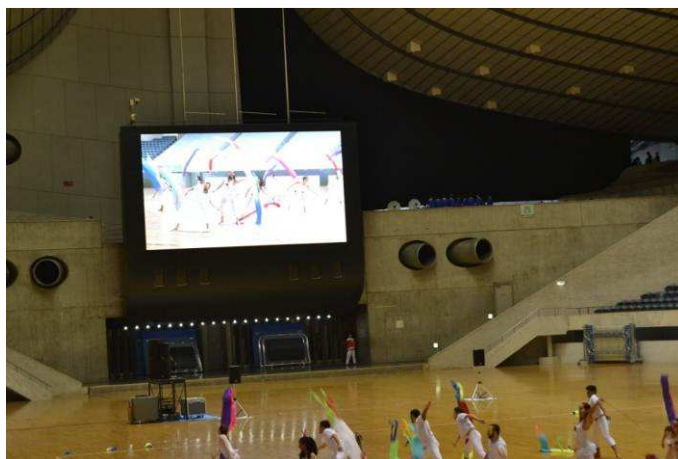
Figura 4 – Coreografia “Piaba” do GGU.

Após suas apresentações, cada grupo era conduzido para uma área reservada, onde eram fotografados por um profissional, a fim de obter um registro oficial das participações, imagens que irão compor o programa do festival do ano seguinte. Este programa, em forma de uma revista, é entregue para todos os espectadores e participantes, com informações como: ordens de apresentação, nomes dos grupos, número de integrantes e informações sobre os convidados.