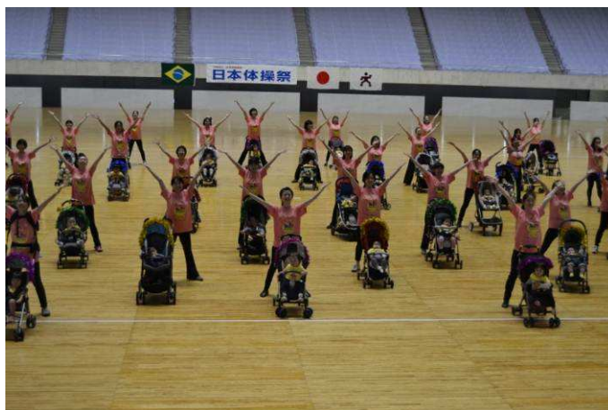
Figura 6 – Coreografia com mães e bebês em carrinhos.

Com respeito às manifestações gímnicas presentes nas apresentações, observamos: GG (19), Dança (14), Ginástica Rítmica (8), Ginástica Feminina (8), Ginástica Artística (5), Ginástica Acrobática (2) e Cheerleaders ou animadores de torcida (2). Completam esse rol de possibilidades, a Ginástica Calistênica em cinco composições coreográficas; e a de Roda alemã, em uma.