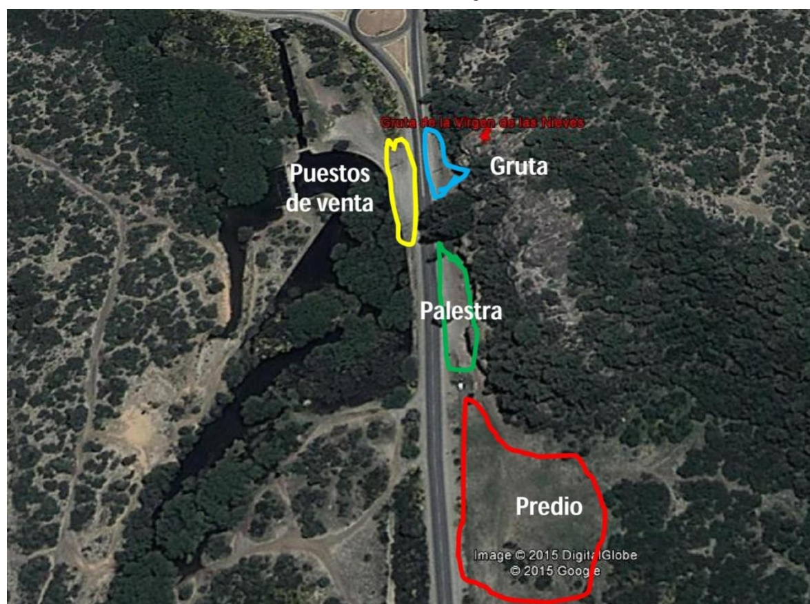
Mapa 2 Delimitación de lugares