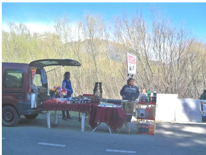
Imagen 7 Puestos de venta