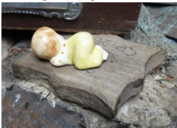
Imágenes 9, 10, 11 y 12

En relación a los objetos materiales se pueden mencionar: mechones de pelo, pañuelos, pulseras, chupetes, fotos, prendas de vestir, cintas, banderas, etc. Los mechones de pelo resultan una ofrenda muy tradicional en el culto mariano, un valor simbólico que alude a “la belleza de la mujer presente en el largo del cabello” 23 (imagen 9). Los muñecos, como bebés de porcelana, también forman parte de los agradecimientos y se vinculan directamente con la acción de encomendar al recién nacido a la devoción (imagen 10). Sin embargo, el resto de los objetos están más relacionados con pedidos específicos por familiares enfermos, a través de las fotos, chupetes, pañuelos, prendas de vestir; por equipos de futbol, con camisetas, cintas y banderas y; por familiares fallecidos, a través de fotos y cartas (imágenes 11 y 12).