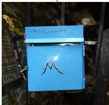
Imagen 8 Buzón de peticiones