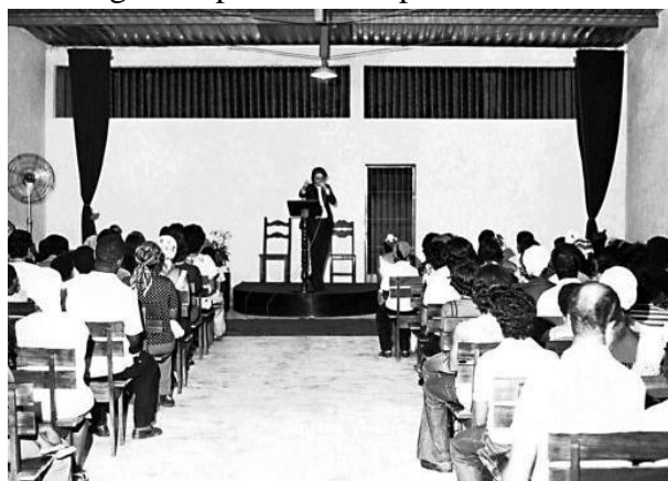
Imagem 1: primeiro templo da Universal

O primeiro templo da Universal, assim considerado pelo seu fundador, foi um “galpão de uma antiga funerária no Bairro da Abolição”, no Rio de Janeiro (Tavoralo, 2007, p. 112), conforme foto abaixo, alugado em julho de 1977. Havia espaço para 225 pessoas nos bancos (Macedo, 2013, p. 66).