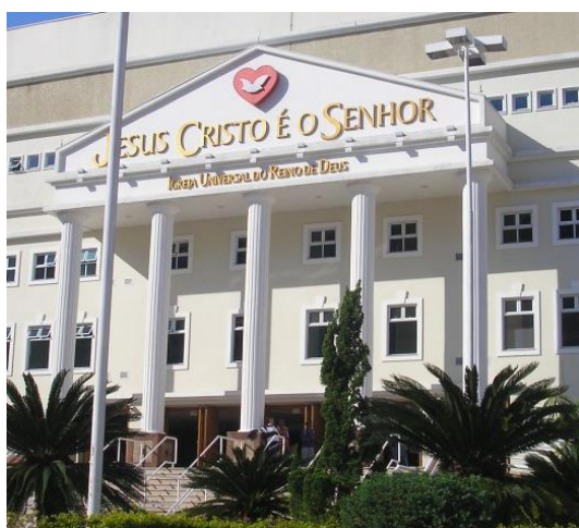
Imagem 5: fachadas de catedrais iurdianas

Completa esta autora dizendo que em suas construções a Universal “privilegia a confecção da fachada com a presença estilizada do pórtico e de frontões triangulares, sustentados por colunas” (Martins e Gomes, 2008, p. 195).