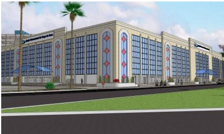
Imagem 12: Sede internacional da IIGD

Por sua vez, a Igreja Internacional da Graça de Deus (IGD), fundada pelo cunhado de Edir Macedo, R. R. Soares, iniciou em 2010 a construção de sua sede internacional, um megatemplo em São Paulo, cuja fachada pode ser vista abaixo, que terá a capacidade para receber 10 mil pessoas, além de planejar a construção de outro grande templo em Madureira, Rio de Janeiro.