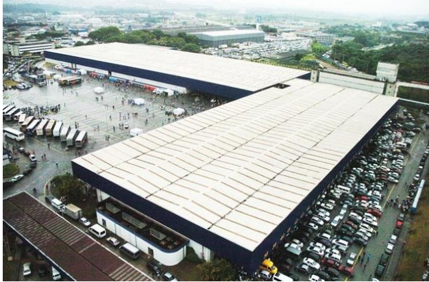
Imagem 11: Cidade Mundial da IMPD

Já a Igreja Mundial do Poder de Deus (IMPD), fundada e liderada pelo apóstolo Valdemiro Santiago, ex-pastor da própria Universal, inaugurou em julho de 2014, em Santo Amaro, Largo do Socorro, São Paulo, a sua Cidade Mundial, que se vê na foto a seguir, obra iniciada em 2009, com capacidade para receber 30.000 pessoas.