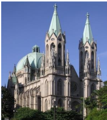
Imagem 7: Conjunto de catedrais católicas e iurdianas