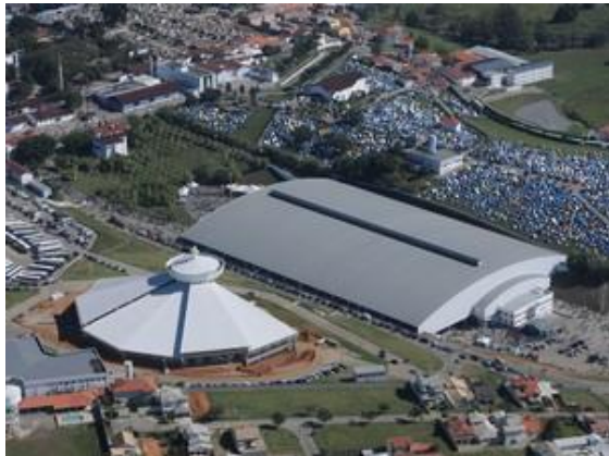
Imagem 9: Megatemplo da Canção Nova