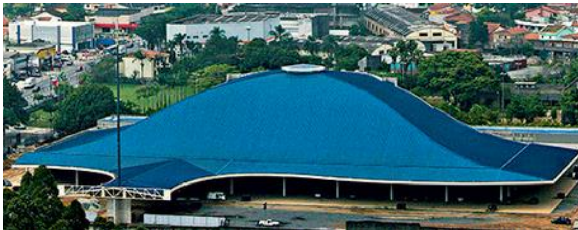
Imagem 10: Santuário Mãe de Deus

Ainda no âmbito católico o padre-cantor Marcelo Rossi iniciou em 2006 a construção do Santuário Mãe de Deus, em Santo Amaro, São Paulo/SP, obra que foi inaugurada em 2 de novembro de 2012. O custo da obra, visível na foto abaixo, foi de 65 milhões de reais e a área construída é de 6.000 metros quadrados. O altar fica a 4 metros de altura, mede 430 metros quadrados e a sua nave comporta 10 mil pessoas sentadas e 15 mil em pé.