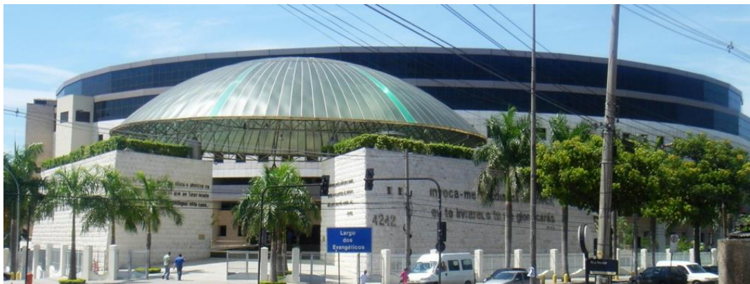
Imagem 3: Catedral Mundial da Fé

Um prédio monumental (...) uma construção colossal. São 72 mil metros quadrados de área construída, com praça de alimentação, sala de convenções, bibliotecas, berçários, estúdios de tevê e rádio, estacionamento para 725 carros e heliporto. A arquitetura é arrojada (...). As inscrições bíblicas em dourado, o museu da Universal, as salas dos projetos sociais, o muro construído com pedras de Israel, o centro de convenções para formação de novos pregadores.