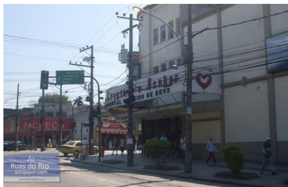
Imagem 2: conjunto de templos da Universal advindos de antigos cinemas e teatros

A maioria dos templos referidos era composta de grandes espaços desocupados que eram alugados e alguns adquiridos pela Universal, sobretudo cinemas, mas também teatros, fábricas, garagens e galpões. A Universal se apropriava desses grandes espaços e, evidentemente, os adaptava às suas práticas e crenças, sacralizando-os como templos ou igrejas. As fotos a seguir mostram alguns cinemas que se tornaram templos da Universal.