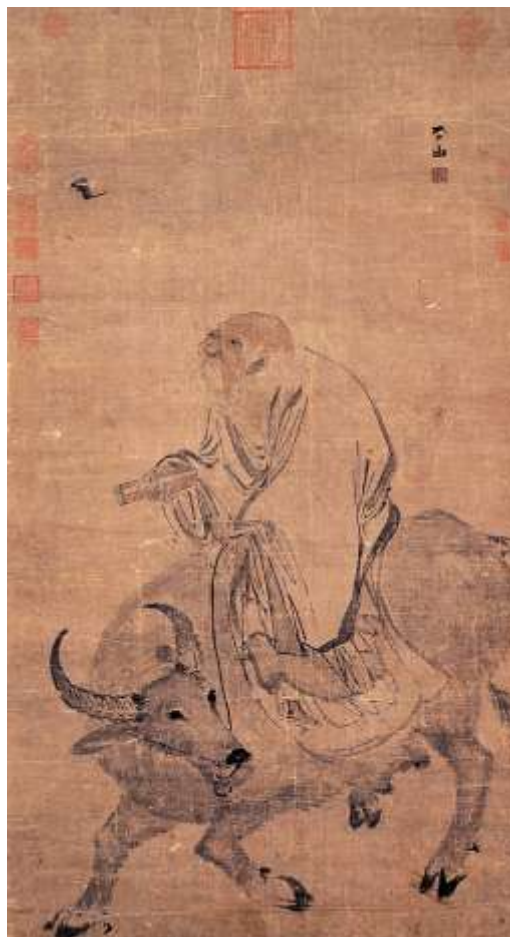
Figura 5: Imagen de Lao-Tse, pintada por Zhang Lu, dinastía Ming, National Palace Museum, Taipei.

Se trata de seres humanos que gracias a su esfuerzo y disciplina (comer solo vegetales crudos, vagar por las montañas, bañarse en las cascadas heladas y dormir al aire libre) y viviendo una vida meditativa recluida en las montañas han llegado a un estado de beatitud e independencia de toda preocupación, siempre en unidad con la naturaleza por seguir “la Vía” el Tao –en chino- o Dō –en japones. El estado de beatitud en el que viven les permite alcanzar la inmortalidad y realizar como “subproducto” toda una serie de proezas físicas (incluso flotar) 3 . Obviamente esta imagen del sabio taoísta ya en China entró en diálogo con la imagen de los maestros iluminados del budismo Chan –nutrida de la del propio Buda-, que en el Japón dio lugar al budismo Zen.