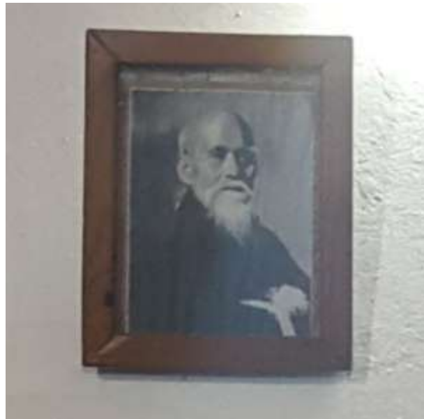
Figura 3: Retrato de Ō-Sensei en el kamiza de un dōjō de Aikido del Gran Buenos Aires.

Allí su imagen, casi siempre en blanco y negro, muestra a un anciano de larga barba blanca y mirada enérgica. Se ha ido imponiendo como parte de una estrategia deliberada que comenzó después de la Segunda Guerra Mundial, y privilegió este aspecto de anciano iluminado por sobre las imágenes de Morihei Ueshiba en su juventud.