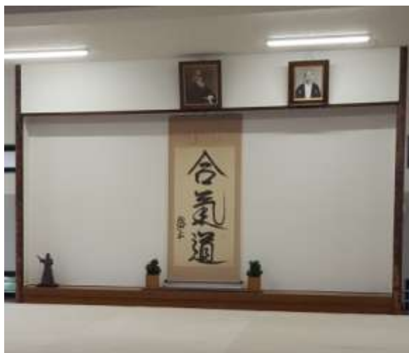
Figura 7: Kamiza del actual Hombu dōjō

Cuando dicho dōjō fue derribado en 1967 para reemplazarlo por el edificio de concreto del actual dōjō central, el kamiza fue rediseñado. En la actualidad se presenta de esta manera: