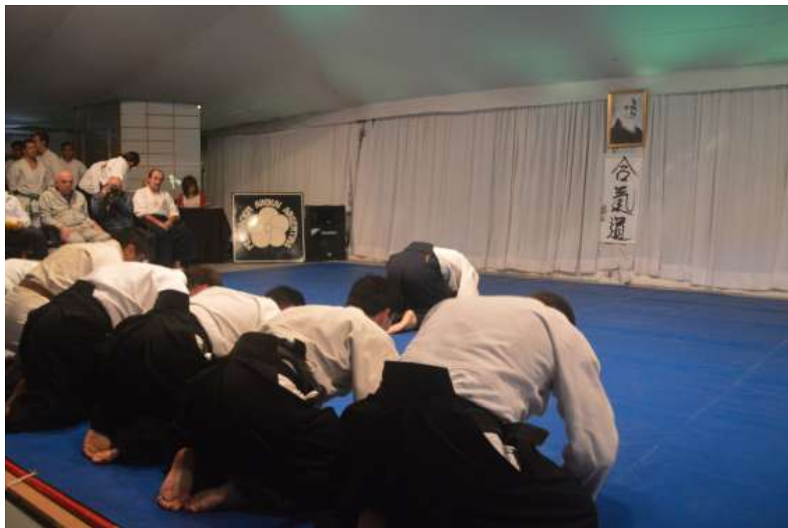
Fig. 2: Saludo al kamiza , Encuentro Nacional de Aikido, Jardín Japonés, Buenos Aires, Federación Aikikai Argentina.

El sensei se gira hacia los alumnos y el alumno más avanzado ( sempai ) dice: Sensei ni rei (“cortesía al Sensei”) y los alumnos se inclinan hasta el suelo saludando al sensei que simultáneamente se inclina hasta el suelo saludándolos. La dinámica general de la clase consiste en que el sensei elige a un practicante avanzado para mostrar una técnica, dando muy breves explicaciones verbales. Lo saluda al comenzar y al finalizar con una inclinación como la ya descrita. Luego los estudiantes forman parejas o grupos –según se requiera– para practicarla y se saludan de manera similar. Al finalizar la clase esta se cerrará con una secuencia idéntica a la de apertura.