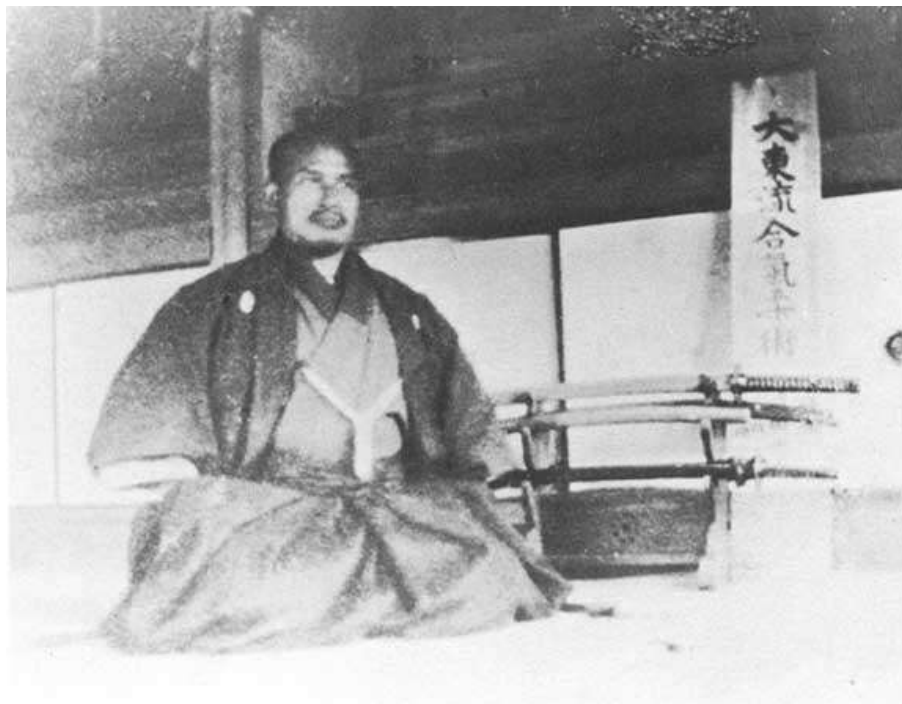
Figura 4: Morihei Ueshiba a los 38 años, en su primer dōjō en Ayabe.

Allí su imagen, casi siempre en blanco y negro, muestra a un anciano de larga barba blanca y mirada enérgica. Se ha ido imponiendo como parte de una estrategia deliberada que comenzó después de la Segunda Guerra Mundial, y privilegió este aspecto de anciano iluminado por sobre las imágenes de Morihei Ueshiba en su juventud.