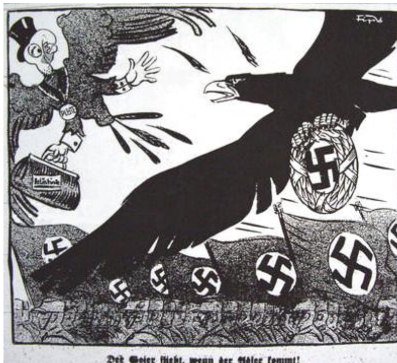
FIGURA 1 – FIPV. Der Geier flieht, wenn der Adler kommt! 2

Localizada temporalmente na primeira fase da publicação e do movimento nazista, a charge abaixo é, antes de tudo, um exemplo do caráter antissemita e persecutório do semanário. A reconstrução de seus sentidos revela as estruturas e as disposições que permeiam e definem a sociedade em que ela foi produzida.