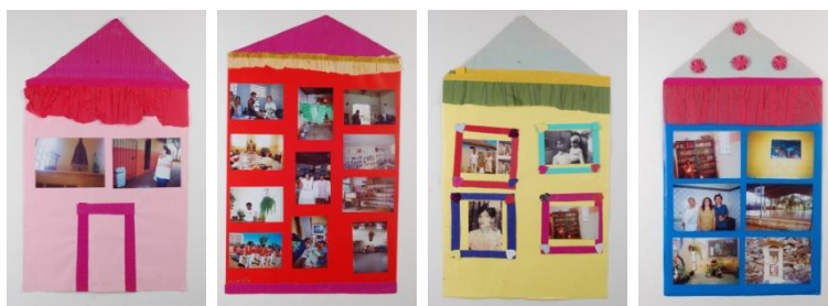
FIGURA 8 – Painéis da exposição confeccionados pelas participantes 8

Desde o início da proposta da oficina já havia sido discutido com as idosas que o círculo de produção imagética só se fecharia com a devolução dos resultados através de uma exposição a ser realizada em local por elas escolhido.