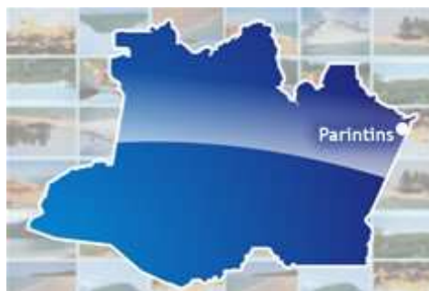
FIGURA 1 – Município de Parintins

É um dos municípios brasileiros do Estado do Amazonas com a dimensão de 7.069 Km 2 . A distância de Parintins à Manaus - capital do estado do Amazonas é de aproximadamente 370 km (em linha reta), 420 km (via fluvial). Segundo IBGE 4 , Parintins possui uma população de 102.033 habitantes. Tem uma economia forte, com base na pecuária bovina, bubalina e agricultura. Além disso, a cidade tem um comércio movimentado e dispõe de opções de diversão e lazer em todas as épocas do ano.