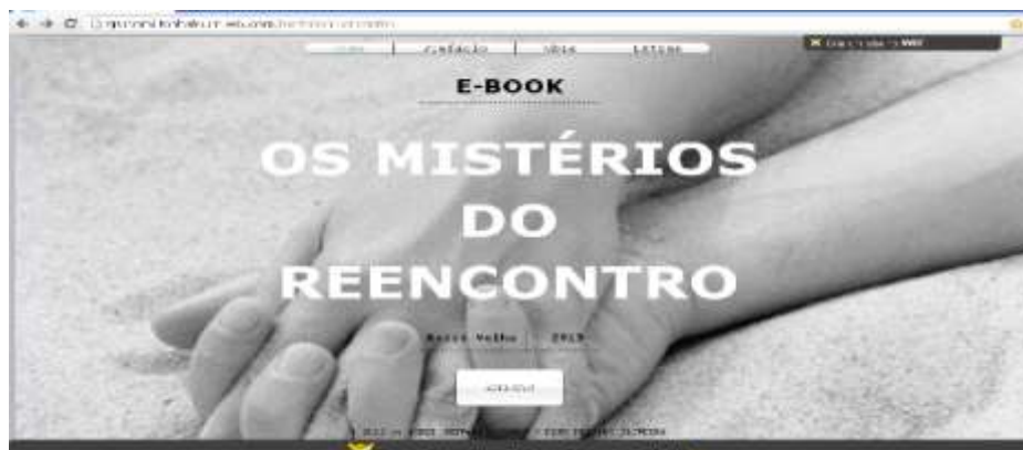
FIGURA 5 – Página do conto Os mistérios do reencontro

encontro de um ardente desejo do homem contemporâneo, os estudantes do Ensino Médio passaram a utilizar a rede para publicar seus dois contos: