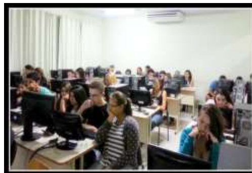
FIGURA 3 - Leitura na tela

As competências de leitura exigidas aos alunos que prestam o Sistema de Avaliação da Educação Básica (SAEB) são analisadas por Bridon (2013) que afirma que os resultados dessas avaliações sinalizam que os alunos estão abaixo do nível esperado em leitura, e que há a necessidade de os alunos lidarem com textos mais longos e mais complexos para diminuir essas fragilidades. Segundo a pesquisadora, 45,95% dos alunos do 5º ano do Ensino Fundamental, 73,04% do 9º e 70,8% dos alunos do 3º ano do Ensino Médio estão abaixo do nível esperado.