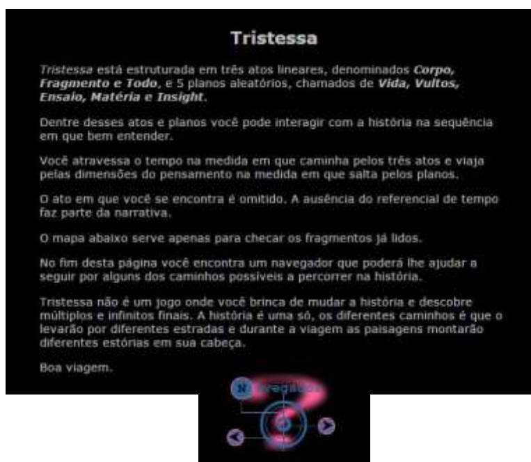
FIGURA 2 – Estrutura da obra Tristessa Fonte: Pajola (2011).

Grau 26 foi a leitura selecionada para introduzir o conceito de intertextualidade, assim como para discutir como o livro impresso pode fazer uso de outras mídias, seja o vídeo, a Internet ou outra. Sua escolha deu-se também porque a escola vem priorizando leituras literárias menos incômodas, lineares e, por isso, a escolha de uma obra que, de forma aparente, encaminha o leitor para outros suportes de leitura, buscando desacomodar os leitores. Um romance do gênero policial, que não foi objeto de leitura na íntegra, empregada para exemplificar o processo rizomático do texto que vai se abrindo a cada link . O encontro com esse romance impulsionou o grupo a buscar outras leituras, de outras narrativas que possuíam dinâmicas análogas, mas em outros suportes, até a descoberta da primeira narrativa brasileira publicada na Internet , Tristessa 2 , de Marco Antonio Pajola.