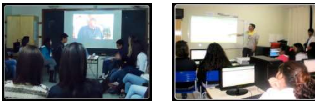
FIGURA 4 - Etapas da produção: pesquisa de textos multimídias e estudo sobre o Google Docs

Na etapa anterior à produção escrita, foi proposta a leitura de alguns contos do livro Cidade Ilhada de Milton Hatoum para que os alunos pudessem observar a estrutura de um texto narrativo impresso. A estratégia leitora adotada foi a leitura silenciosa seguida de debate interpretativo. O desafio era não apenas construir uma narrativa em grupo, mas produzir um texto multimídia.