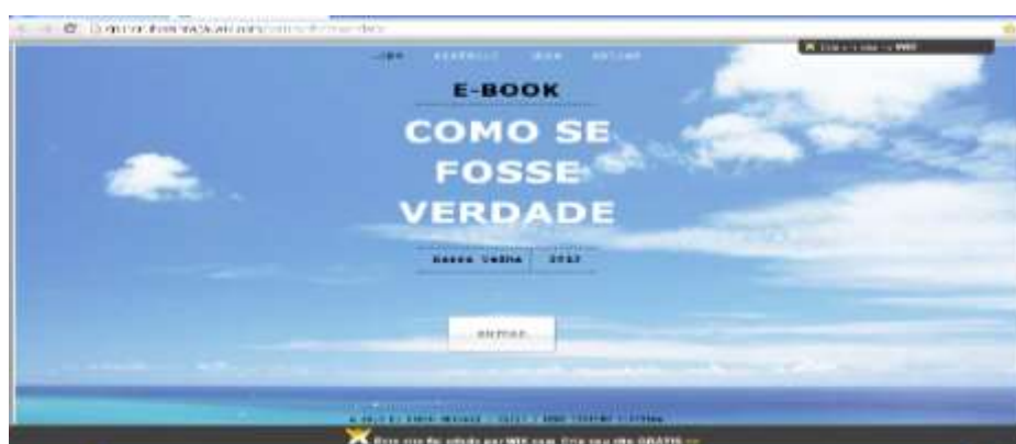
FIGURA 6 – Página do conto Como se fosse verdade

A participação nessa atividade de leitura e produção de textos mobilizou o grupo, movimentou-os à criação de textos que pulsam, vibram e emocionam. Constatamos que esse grupo, cuja maioria não tinha hábitos de leitura, viveu uma experiência literária que o tocou, atraiu, afetou, que o convidou a ver o texto literário em outra ótica. O que tornou a atividade tão dinâmica? Na função de leitores e de escritores, os alunos descobriram possibilidades de leitura e produção em meio digital. Para Donnat (2012), as jovens gerações manifestam um interesse crescente pelas novas formas de narrativas e suas referências são cada vez mais aquelas que exploram as tecnologias tais como a televisão, o vídeo game, o cinema e produções multimídias, entre outras. Essa imersão do jovem nas tecnologias não pode ser vista, segundo o pesquisador, sem consequências no campo da leitura, pois sua capacidade de ler é afetada assim como seu imaginário.