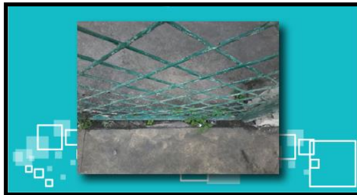
Figura 4 – Desafio 2: Onde é isso?

Fonte: fotografia cedida pela Participante Dorothea, (AUTOR X, 2017)