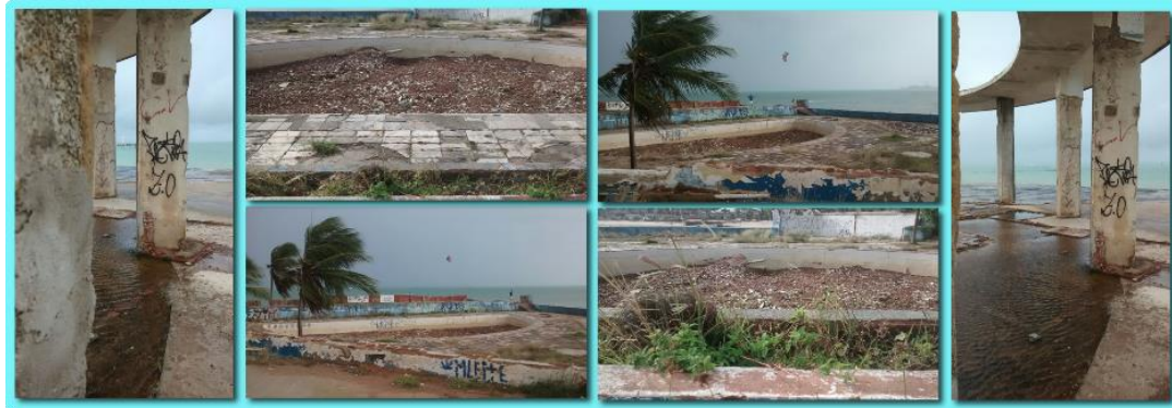
Figura 3 – Desafio 4: foto-denúncia

Percebemos que o desejo de aprender pode contribuir no desenvolvimento de múltiplas aprendizagens. Um exemplo foram as fotografias de Dorothea na figura 3 do desafio foto-denúncia 9 que foi inspirada nas obras de Sebastião Salgado: