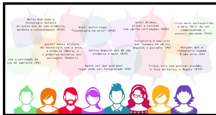
Figura 5 – Unidades de registro do olhar técnico

Retomamos a ideia da Abordagem Triangular de Barbosa para vislumbrar que durante o projeto houve momentos de leitura de imagem como fala P3 “despertando novas maneiras de analisa as fotografia (sic) (SILVA, 2017, p.116)”, de análise crítica de fotografias e contextualização sobre os fotógrafos estudados em paralelo com suas realidades no qual segundo P12 puderam “Aprender sobre a fotografia e poder interagir” (SILVA, 2017, p.116), bem como um espaço de produção artística como destaca Anne “eu tirei uma foto que a luz ficou em um ponto muito bom que eu pensei que não ia ter aquele resultado, acho que foi isso, a luz e o momento” (SILVA, 2017, p.116). Selecionamos outras opiniões (questionário final, 2017) que trazem percepções sobre o uso de celulares nas aulas de Arte conforme a figura 5: