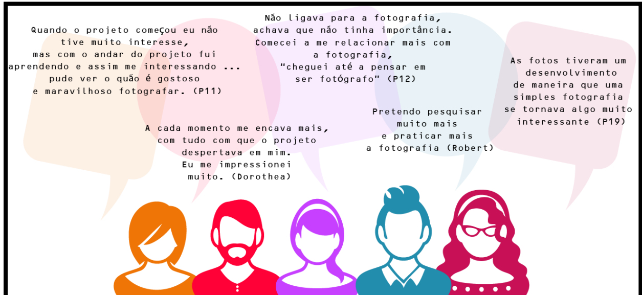
Figura 2 – Unidades de registro do olhar pessoal

sujeitos, meios e objetos. Selecionamos na figura 2 algumas transcrições que trazem essas percepções a partir das seguintes unidades de registro: