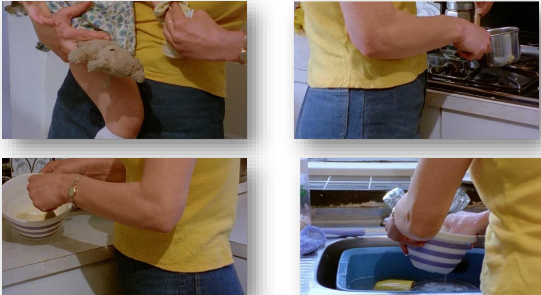
Figura 1 Riddles of the Sphinx (1977). Sequência de Louise nos afazeres domésticos. Nesta sequência, o enquadramento fecha em apenas uma parte do corpo da mulher, sem que possamos ver seu rosto. No plano-sequência, são filmadas em 360º suas repetições diárias na casa e com a filha bebê.