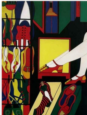
Figura 3: Wanda Pimentel - Envolvimentos .

Wanda Pimentel, artista brasileira, também se utilizou das formas de sensibilidade sobre o espaço feminino na arte para revelar uma crítica à sociedade de consumo e ao período de repressão sexual e ideológica, vigente durante a ditadura militar brasileira. A artista enquadra espaços de forma semelhante aos filmados por Mulvey, com regimes fechados e claustrofóbicos, reivindicando que o corpo feminino ocupe seu espaço na arte.