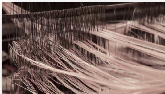
Figura 5: Tão longe é Aqui (2013). Cenas da cineasta no Mali filmando trabalhadoras em um tear.

A sequência dessas cenas endereça uma narrativa pensada para um determinado público. As imagens mostradas por Eliza exibiram uma realidade que se desvinculou da narrativa mostrando aquilo que “escondem” pois, requerem uma postura diferente de espectadoras e espectadores. Com este jogo de cena a diretora chama atenção à complexidade das tecituras sociais e culturais, que se furtariam a qualquer alternativa de fácil conclusão a e este respeito.