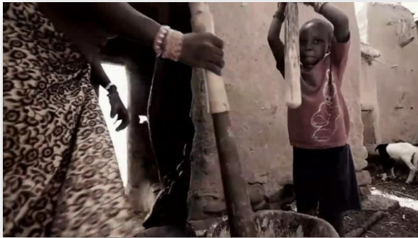
Figura 6 - Tão longe é Aqui. (2013) Cena de mulheres trabalhando em um pilão.