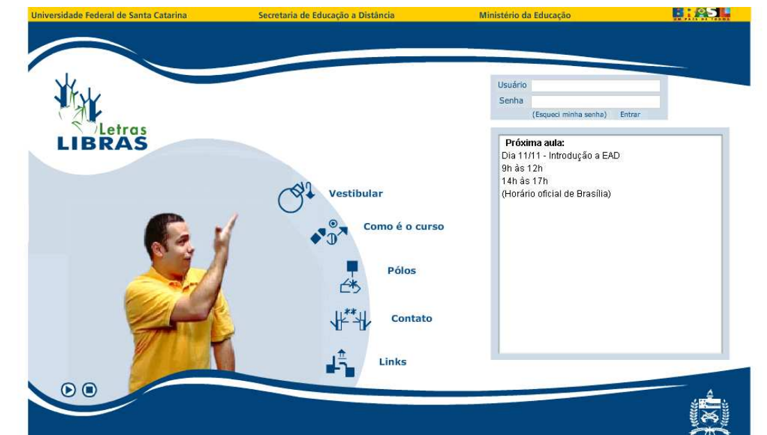
FIGURA 7 – Apresentação da página do Curso de Letras Libras

A página de entrada do curso é uma porta de acesso aos textos de domínio público, bem como de acesso às diferentes informações de interesse da comunidade do curso de letras libras. Uma das solicitações dos alunos foi a da criação de uma galeria de fotos. Esse interesse também reflete uma das formas de registro muito comuns entre os surdos. A história do curso