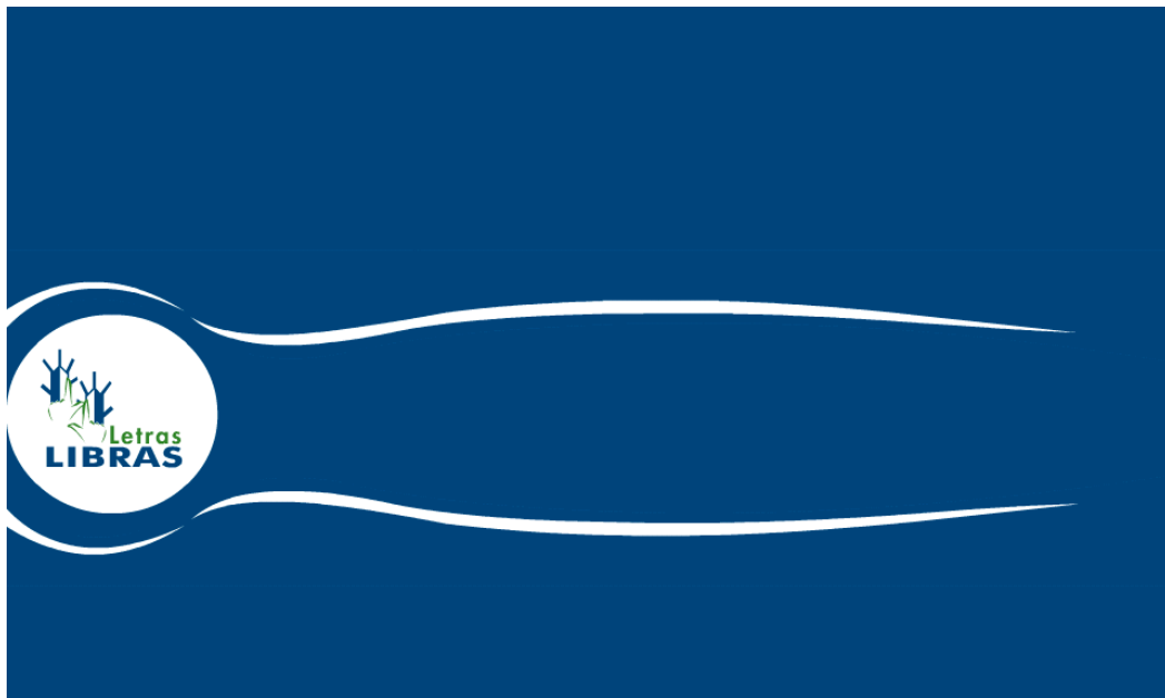
FIGURA 6 – Abertura da página do Curso de Letras Libras