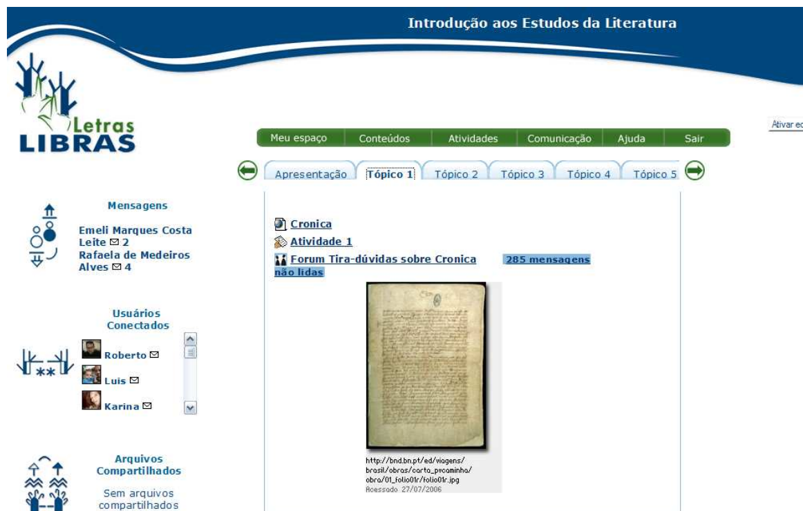
FIGURA 2 – Aspectos gráficos da interface do aluno em uma disciplina

Definiu-se que a navegação de Alunos pelo AVEA inicia-se pelo seu pólo, de onde este tem acesso as suas disciplinas. Para a navegação de professores, tutores e monitores, esta se inicia pelo Espaço da Equipe de Ensino. a partir do qual são acessados outros espaços, disciplinas ou pólos.