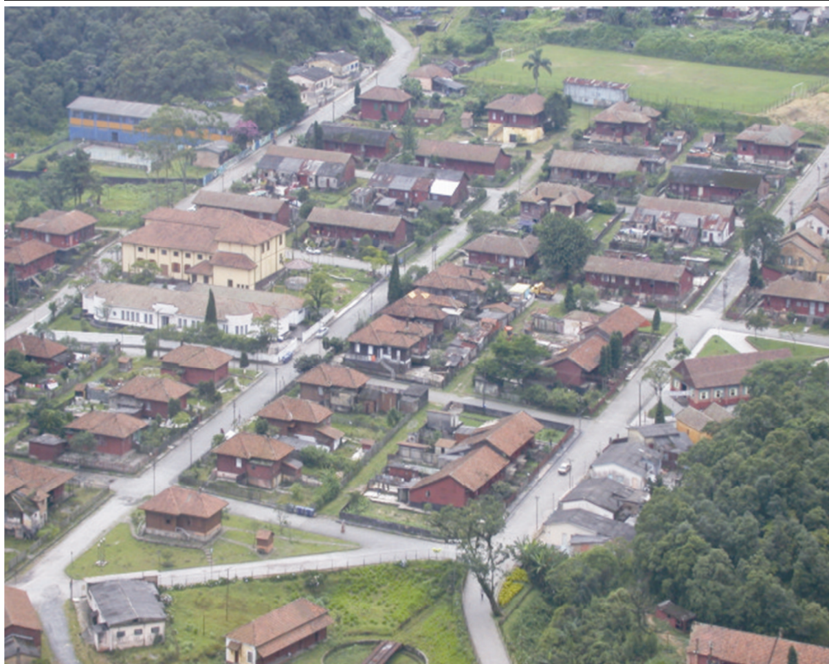
Figura 4. Paranapiacaba, Vila Nova, 2006.

Embora predominantemente residencial, o projeto inglês não esqueceu de garantir espaço aos equipamentos urbanos necessários à vida na Serra, inclusive o lazer. Entre 1899 e 1907 foi construído o Clube Sociedade Recreativa Lyra da Serra, e a sede do Serrano Atlético Clube, que fundiram-se criando o Clube União Lyra Serrano, cuja nova sede erguida em 1938 permitiu intensificar a vida social dos ferroviários com a realização de bailes, jogos de salão, teatro, exibição de filmes e da famosa Banda Lyra. O antigo mercado, local de comércio de secos e molhados, data de 1899. O primeiro grupo escolar iniciou seu funcionamento em 1911 em um espaço adaptado em duas unidades residenciais em madeira e em 1939 teve sua nova sede inaugurada em edificação de alvenaria.