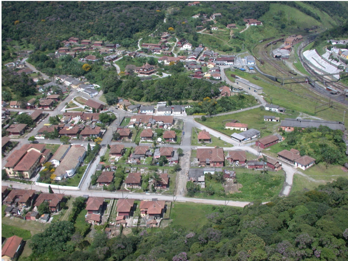
Figura 6. Paranapiacaba: Paisagem Cultural. Vista Geral, 2006.

ambiente construído e do espaço urbano, a valorização da paisagem e o desenvolvimento sustentável” (Art.73, Seção IV, PD, Lei nº. 8.696/04).