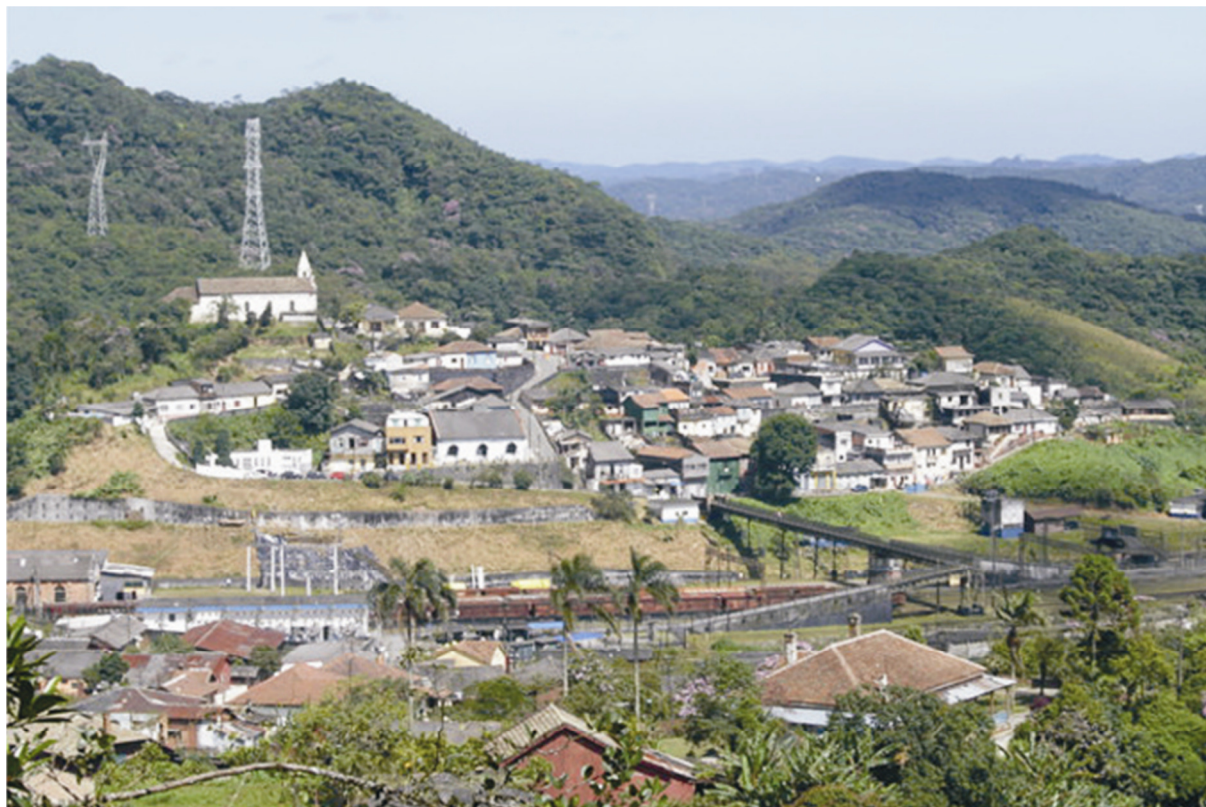
Figura 5. Paranapiacaba, Parte Alta, 2005.

influência do período colonial com ocupação tipicamente portuguesa, em suas ruas estreitas e sinuosas foram erguidas edificações coloridas e irregulares, de pequena frente e implantadas geminadas e sem recuos laterais. Entretanto, a influência da tradição inglesa é notada nos materiais de construção, como a madeira, utilizada em algumas edificações.