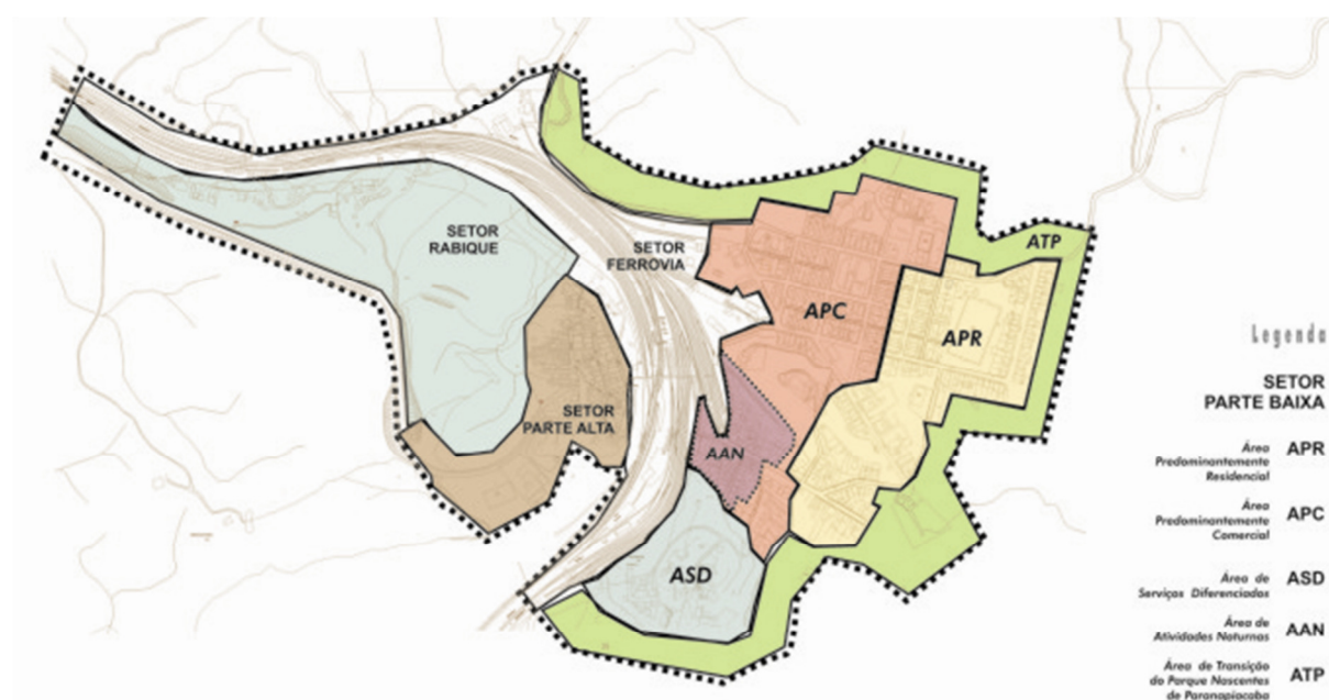
Figura 7. Paranapiacaba: Zoneamento. Mapa: Vanessa Figueiredo.

A ZEIPP propõe a divisão da Vila em quatro setores de planejamento urbano (Parte Alta, Parte Baixa, Ferrovia e Rabique), reconhecendo as especificidades urbanas e históricas de cada parte da Vila. Cria um zoneamento priorizando o uso residencial e definindo áreas para o desenvolvimento das atividades comerciais e turísticas, diminuindo assim os conflitos de vizinhança. O zoneamento (Figura 7) fixa o estoque habitacional em 50% dos imóveis públicos da Parte Baixa (cerca de 170 imóveis), ou seja, garante em lei a manutenção do uso residencial.