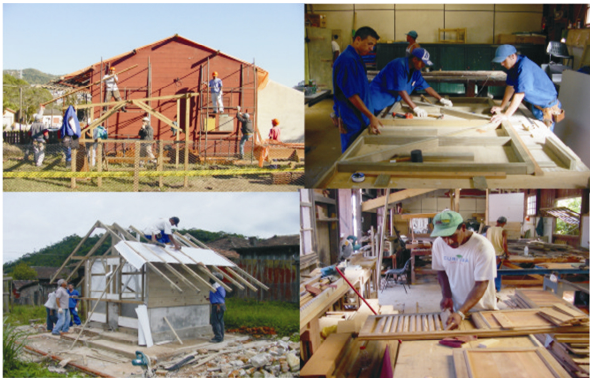
Figura 8. Cooperativa de Marcenaria, Oficina do Banco de Materiais e Restauro das Casas Tipo E-CDARQ.

A cooperativa de restauradores formou-se com quinze moradores da Vila capacitados para trabalhar especificamente com restauro e conservação em madeira (carpintaria e marcenaria). Até 2008 a cooperativa já havia restaurado um conjunto de quatro casas Tipo E, que abrigam o CDARQ; uma casa de engenheiro incendiada; a Antiga Padaria e os cercamentos de uma quadra. Além disso, a cooperativa produzia elementos construtivos das casas, como portas, janelas, mãos francesas, beirais e cercas, visando à constituição de um banco de materiais para reposição adequada de elementos arquitetônicos degradados, cumprindo uma das diretrizes específicas de preservação constante na lei da ZEIPP.