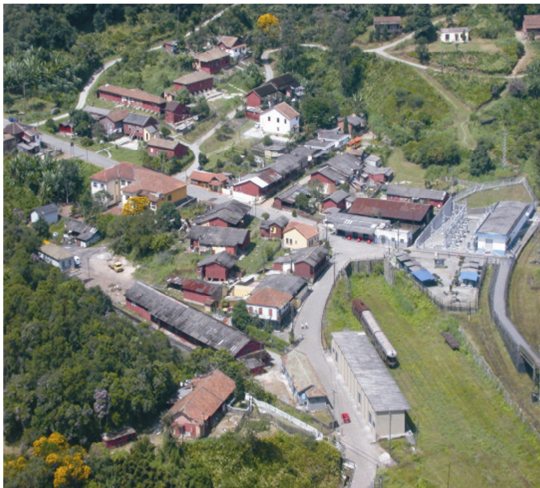
Figura 3. Paranapiacaba – Vila Velha, 2006.

provisórias ainda de pau-a-pique e sapé, assentadas desordenadamente ao longo da via de acesso principal à Parte Baixa da Vila: a rua Direita. A fixação destes operários demandou, em 1874, a construção da primeira estação – a Estação Alto da Serra – localizada no início da Rua Direita, ao lado do Largo dos Padeiros.