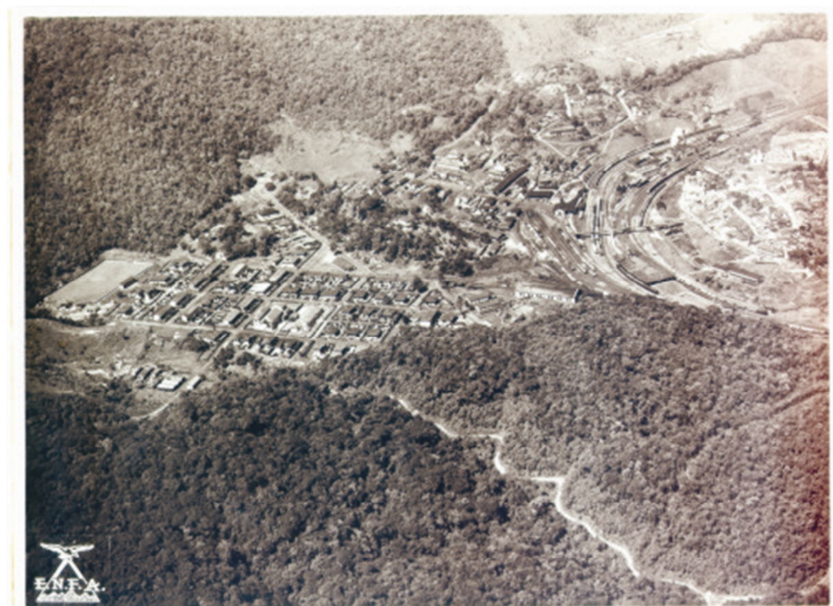
Figura 1. Foto Aérea de Paranapiacaba em 1940.

preservação do patrimônio cultural, conservação ambiental, turismo sustentável e participação cidadã.