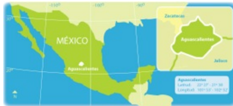
Figura 1. El Estado de Aguascalientes en la República Mexicana.

En el año de 1980 el gobierno del pequeño Estado de Aguascalientes, situado en el centro de la República Mexicana, prescribió en su Plan Director de Desarrollo Urbano la estrategia de fomentar el crecimiento de su capital homónima hacia los lomeríos de su parte oriente; dicha estrategia, por cierto, fue implementada como medida de mayor control político del poblamiento a efectos de contrarrestar el proceso de asentamiento insurgente de mediados de los años setenta, experimentado en la zona sureste de la mancha urbana (BASSOLS, 1997). Muy poco tiempo después, en 1985, con la llegada de un fuerte contingente de trabajadores del Instituto Nacional de Estadística, Geografía e Informática (INEGI) a la capital de este estado, como parte de la política de descentralización del