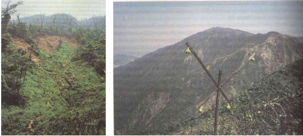
Figura 3. Áreas degradadas na Serra do Mar.

poluição industrial. Na década de 1980, a situação de degradação das encostas (ver Figura 3) foi tão profunda que causou a morte de grande parte da vegetação nas encostas atingidas pelos gases tóxicos emanados das indústrias (GUTBERLET, 1996; COUTO, 2003).