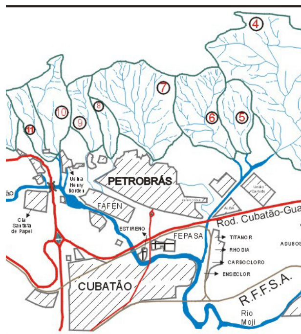
Figura 5. Bacia do Córrego das Pedras em amarelo, onde ocorreu a corrida de lama de 06/02/94.