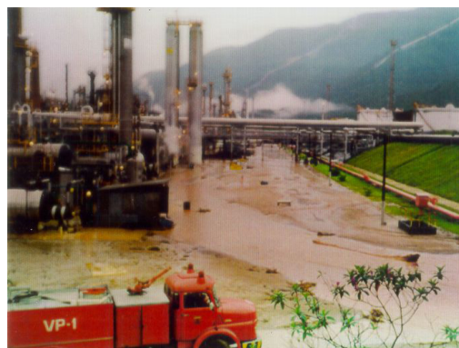
Figura 6. Lama na área industrial, em 06/02/94.