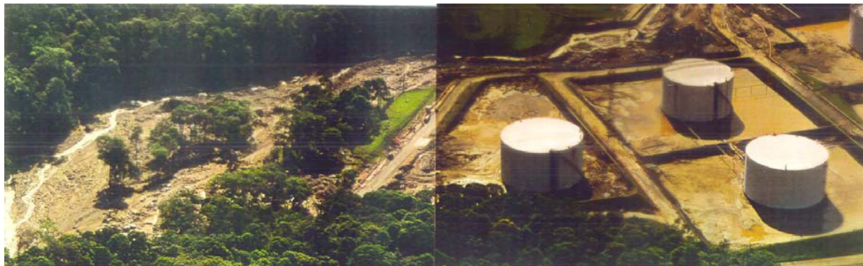
Figura 4. Área Industrial, junto à Bacia do Córrego das Pedras, na corrida de lama de 06/02/94.