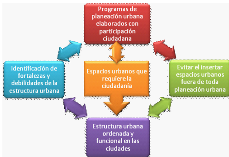
Figura 4. Esquema de beneficios obtenidos por medio de la participación ciudadana incorporada en la realización de los programas de planeación urbana.

Al hablar de la participación de la ciudadanía en el ámbito de la planeación urbana, se tendrá que considerar a la ciudadanía que represente los diferentes sectores que conforman una ciudad, dependiendo del nivel de la planeación; al hablar de la planeación de la ciudad se tendrá que considerar la población de todos los sectores que la conforman, si se trata de un programa parcial o sectorial, solamente se considerara la ciudadanía involucrada en ese sector; en el caso de programas destinados a colonias o localidades, se considerara la población perteneciente a estos lugares; para todos los casos se buscara para estas representaciones de la ciudadanía, la coordinación con las diferentes organizaciones sociales, entre estas, las