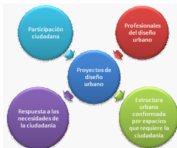
Figura 1. Esquema de participación ciudadana como componente esencial en el proceso de realización e implementación de los proyectos de diseño urbano.

Por medio de los proyectos de diseño urbano se construyen los espacios públicos donde las personas viven, interactúan, perciben, y sienten la ciudad, en estos espacios es donde las personas complementan su vida cotidiana con diferentes actividades que pueden desarrollar gracias a estos espacios, actividades de tipo sociales, culturales, recreativas, deportivas, entre otras. Estos espacios contribuyen de gran manera para mejorar la calidad de vida de las personas, para mejorar el medio ambiente, y para dar un impulso ecológico al tejido urbano de las ciudades.