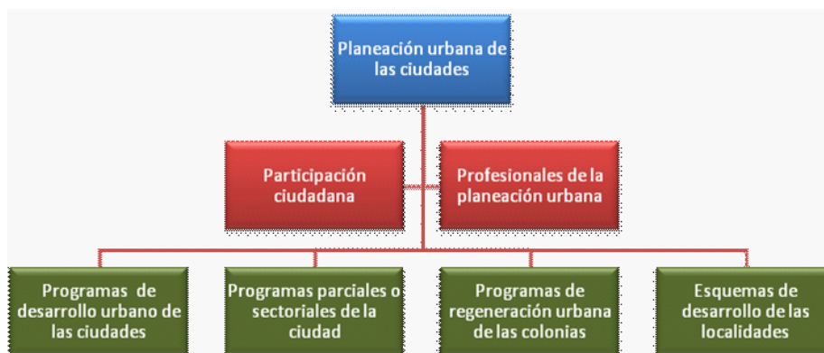
Figura 3. Esquema de participación ciudadana, considerada en todos los niveles de la planeación urbana de las ciudades.

Esta participación de la ciudadanía se deberá realizar en conjunto con los profesionales de la planeación urbana, encargados de la elaboración de los programas de desarrollo.