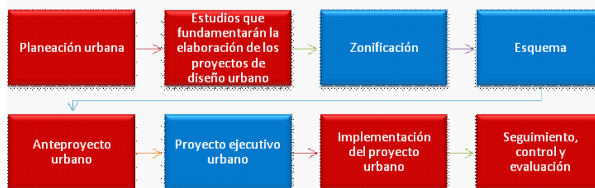
Figura 2. Esquema de etapas establecidas en nuestro proyecto de investigación, para el proceso de realización e implementación de un proyecto de diseño urbano.

Para proponer la participación de la ciudadanía en el proceso de elaboración e implementación de un proyecto de diseño urbano, se comenzara por establecer las etapas que se consideraron en nuestro estudio para conformar este proceso, cabe mencionar que el proceso para la elaboración e implementación de un proyecto de diseño urbano, no es algo línea o establecido, este proceso es decisión de cada profesional o profesionales del diseño que estén inmersos en la realización de un proyecto urbano de acuerdo a sus objetivos particulares; las etapas presentadas a continuación como ya se menciono son las establecidas en nuestro proyecto de investigación: La primera etapa considerada es la planeación urbana, la segunda etapa son los estudios que fundamentarán la elaboración del proyecto de diseño, la tercera etapa se refiere a la zonificación y esquema del proyecto, la cuarta etapa se refiere a la elaboración del anteproyecto urbano, la quinta etapa a la realización del proyecto ejecutivo, la quinta etapa se refiere a la implementación o construcción del proyecto urbano y finalmente la quinta etapa se refiere al seguimiento, control y evaluación del proyecto de diseño urbano realizado.