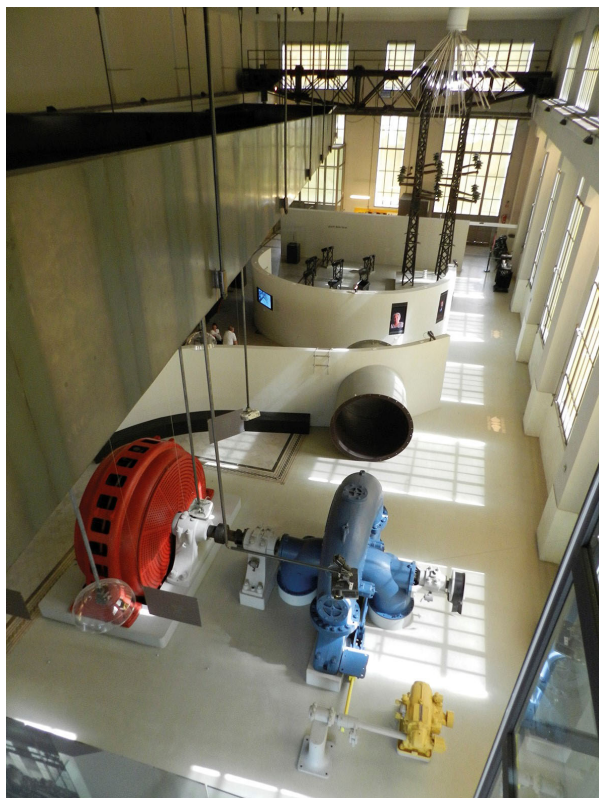
Figura 6. Museo dell'energia idroelettrica. Cedegolo (Brescia, Italia). Particolare del percorso espositivo.

como vertiente del turismo cultural, conecta la geografía del turismo con los itinerarios a las huellas y vestigios de la industria y también a su patrimonio vivo: factorías, centrales eléctricas, minas, puentes, canales, altos hornos, imprentas, cerámicas y cementeras, todo un conjunto de elementos o monumentos de la industria que describen sendas cargadas de historia y simbolismo (Álvarez Areces, 2017, p. 133),