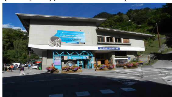
Figura 8. La Galerie Hydraulica a Le Planay (Savoia, Francia).

Per quanto attiene in particolare il patrimonio dell'idroelettricità, sono state di recente avviate una serie di attività volte a incrementare la sua fruizione da parte di un pubblico costituito non necessariamente da esperti e specialisti del settore, ma anche da famiglie, scolaresche, persone di diversa età ed estrazione culturale, interessate a comprendere il funzionamento dell'intero sistema produttivo e a capire dove e come viene prodotta quella energia di cui quotidianamente ciascuno di noi fruisce ogniqualvolta anche solo semplicemente accende la luce nella propria abitazione (Frantál, Urbánková, 2014). A tale scopo sono stati allestiti musei quali ad esempio il Museo dell'energia idroelettrica di Cedegolo, facente parte del sistema MUSIL (Museo dell'Industria e del Lavoro di Brescia 7 ). Il museo di Cedegolo è ospitato all'interno di una ex-centrale idroelettrica dismessa nel 1962 e si propone di raccontare una fase importante dell'industrializzazione italiana, di valorizzare il patrimonio industriale e la cultura materiale della modernità, di diffondere la conoscenza di carattere scientifico e di favorire l'acquisizione di una maggiore consapevolezza relativamente ai temi dell'energia e dell'ambiente (Azzoni, 2008). L'itinerario espositivo è stato pensato con il precipuo scopo di esplicitare in modo chiaro il percorso seguito dall'acqua per consentire la produzione di energia elettrica, mettendo in evidenza il ruolo fondamentale che la ricerca scientifica e