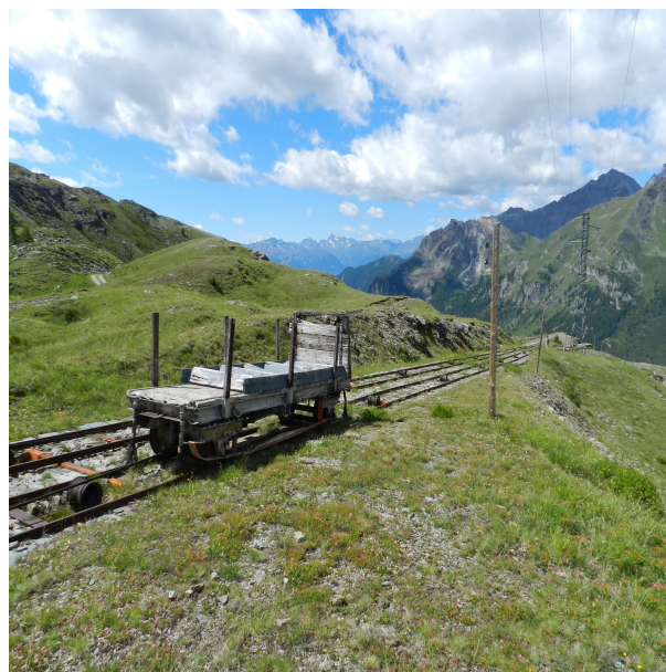
Figura 4. Valtournenche (Val d'Aosta, Italia). Resti della strada ferrata utilizzata per il trasporto dei materiali.