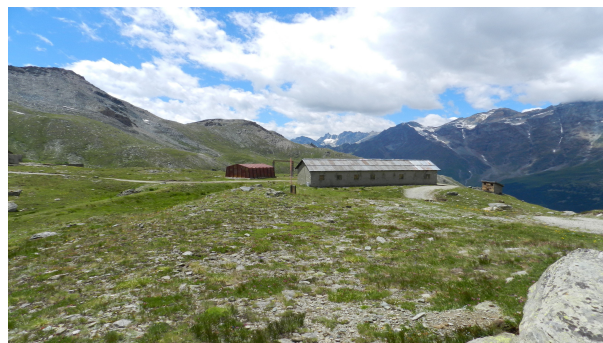
Figura 5. Valtournenche (Val d'Aosta, Italia). Stazione di arrivo della strada ferrata e baracche degli operai in prossimità della diga del Goillet.

L'evoluzione di cui è stato protagonista il concetto di patrimonio a partire dalla seconda metà del XX secolo ne ha determinato una progressiva estensione tipologica, cronologica e geografica 4 e ha visto di conseguenza l'incremento e l'ampliamento delle categorie di beni individuabili come testimonianze materiali [e immateriali] aventi valore di civiltà 5 e, in quanto tali, da preservare e da trasmettere ai posteri. Secondo quanto sancito in Italia dal Codice dei Beni culturali e del paesaggio, il patrimonio culturale è costituito dai beni culturali e dai beni paesaggistici (D. Lgs. 42/2004 e s.m.i., art. 2, comma 1) che comprendono tanto