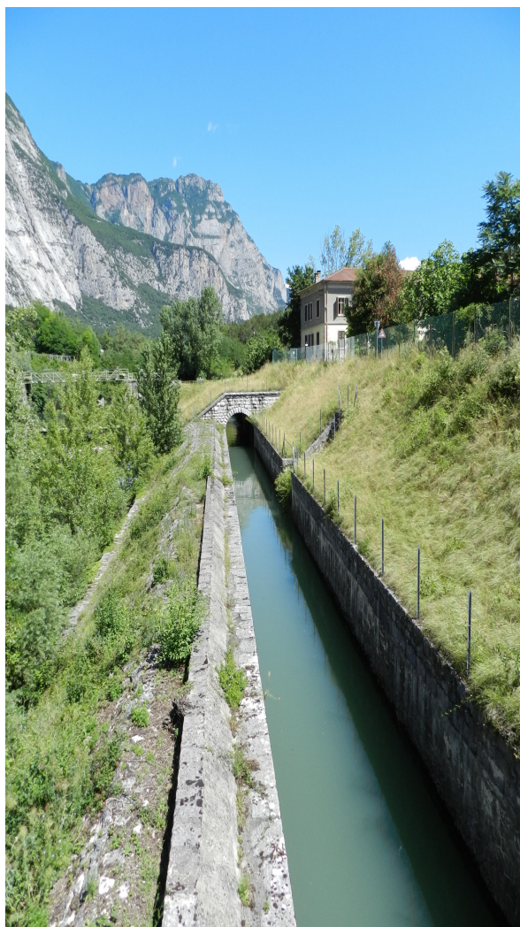
Figura 3. Patrimonio dell'idroelettricità: canalizzazione scoperta in prossimità della centrale di Fies (Trento, Italia) (foto Manuela Mattone).