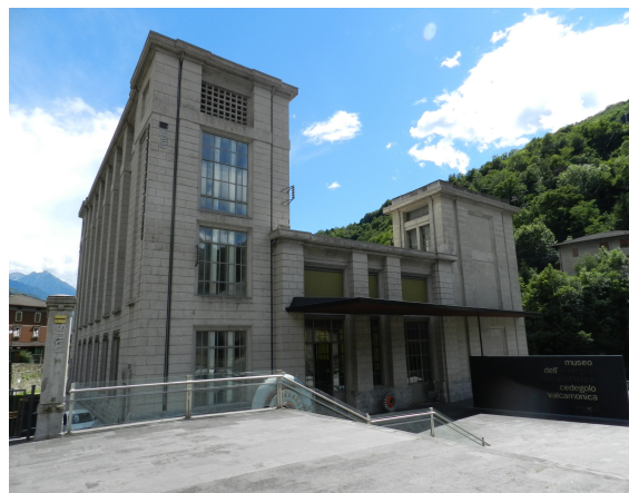
Figura 7. Museo dell'energia idroelettrica. Cedegolo (Brescia, Italia).