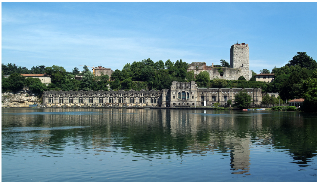
Figura 1. Centrale Benigno Crespi, Trezzo d'Adda (Milano, Italia). Prospetto principale della centrale e retrostante castello medievale.

continui interventi di manutenzione, segnano oggi come in passato i territori montani e, benché al momento della loro realizzazione avessero suscitato notevoli polemiche per il loro forte impatto sul territorio 3 , oggi non sono pressoché più percepite come elementi artificiali, poiché totalmente inglobate nel paesaggio. Le seconde viceversa, venute meno le ragioni e le esigenze per cui erano state realizzate, sono state abbandonate al loro destino e si stagliano nel paesaggio come lacerti privati del loro significato. Questi reperti rappresentano segni del progresso, della rivoluzione e dello sviluppo industriali, ma anche segni delle sofferenze e delle difficoltà che, affrontate e superate dalle generazioni che ci hanno preceduto, hanno reso possibile le attuali condizioni di vita (Di Battista, 2011).