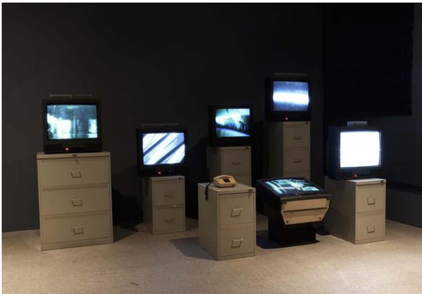
Fig.1. Wolf Vostel, 6 T.V. Dé-collage , 1963 (Remontagem Museu Raina Sophia), seis monitores com transmissão de videotapes com imagens adulteradas, um telefone, seis arquivos de aço, três fotografias em P&B. Fonte: < http://televisionvideowerkewolfvostell.blogspot.com/2012/05/wolf-vostell-6-tv-de-collage-1963.html >. Acesso em: jun. 2020.

A história da videoarte se confunde com a do imbricamento arte e tecnologia, cujas pesquisas se intensificaram universalmente a partir dos anos 1950. Entre as muitas experiências que caminharam nesse sentido, o interesse dos artistas voltado, em especial, para o sistema de transmissão ao vivo via televisão faz parte da genealogia tanto do vídeo como da performance. As primeiras tentativas nesse sentido foram feitas ou imaginadas tanto a partir de interferências em aparelhos quanto da criação de uma arte televisiva e imaterial 1 . No que tange especificamente à videoarte, as apresentações pioneiras de Nam June Paik, Exposition of Music-Electronic Television , em 1963, na Galeria Parnass, em Wuppertal, Alemanha, e a de Wolf Vostel, 6 T.V. Dé-collage [Fig. 1], na Smolin Gallery, em Nova York, nesse mesmo ano, são consideradas marcos fundadores (Zanini, 2018).