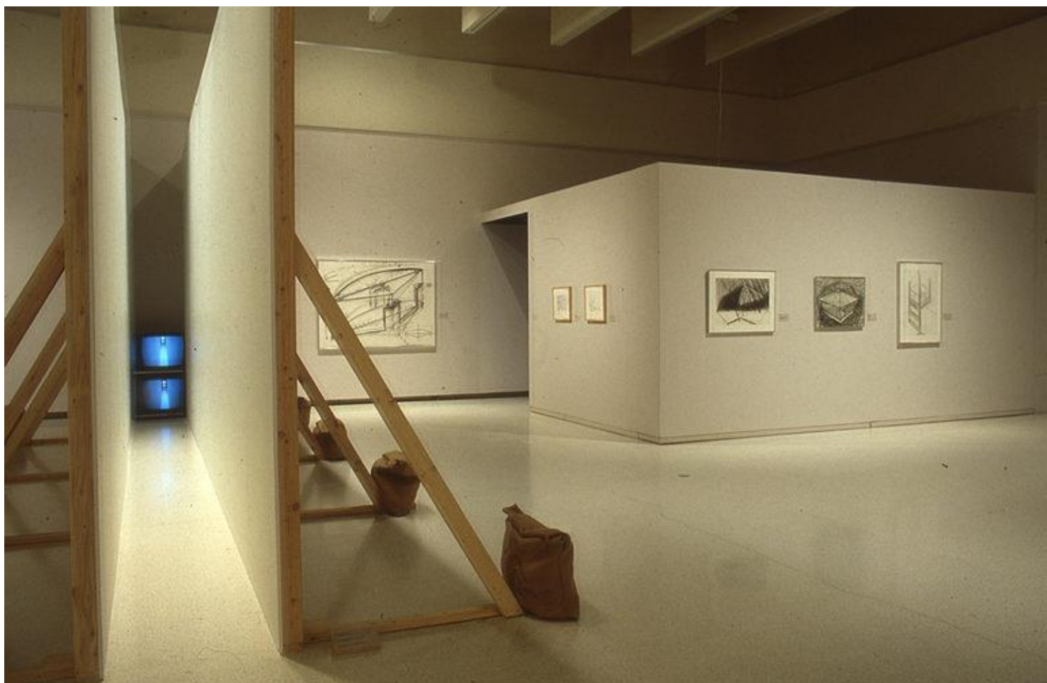
Fig. 2. Bruce Nauman, Live-taped corridor , 1969. Exposição: Origens do vídeo, 1990.

Sabemos que em grande parte o vídeo esteve ligado desde o início à performance, tanto para documentação como para ações pensadas e dirigidas à objetiva. Esse experimento de Nauman, embora nos seja apresentado como uma escultura, interessa-nos particularmente porque toca uma questão sensível no que tange de uma forma particular ao nosso debate em torno da videoperformance e da performance em si. Vista normalmente como uma exposição controlada de um corpo em representação, seja o do artista ou o de algum colaborador, a performance se mostra aqui surpreendentemente embaralhada em seus termos, os quais ainda não estavam totalmente elaborados na época em que o experimento de Nauman foi realizado. A transferência da ação do corpo do artista para o corpo do visitante desavisado no momento em que ele entra no corredor e se vê, mas de forma estranha, capturado nas imagens, é para mim inédita e exemplar.