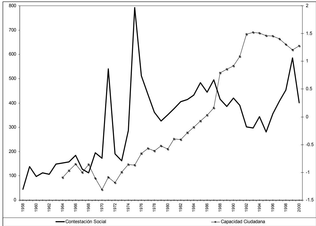
Figura 2. Contestación social y capacidades ciudadanas, Colombia 1958-2000 (Correlación: r = .29^{**} , N = 37 )