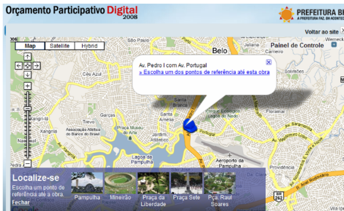
Figura 1 Mapa virtual para localização das obras