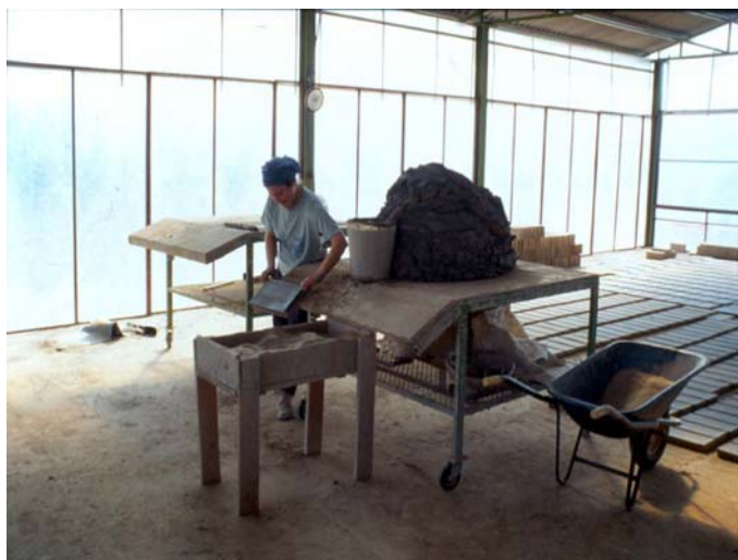
Figura 1. A moldagem e secagem artesanal de tijolos e ladrilhos de barro antes de serem cozidos em forno de lenha. Vetriolo (Viterbo), Itália. Fotografia do autor, 2006.

No campo da sociologia Edward Shils referiu-se à tradição como um padrão orientador, uma forma de conhecimento transmitida entre gerações, passível de algumas mutações (SHILS, 1981, 12). Hobsbawm (1983) introduziu a ideia de 'tradição inventada' para todas as formas de práticas imutáveis tacitamente inculcadas nas sociedades em processos de repetição e referidas ao passado. Outros investigadores preocuparam-se em defender a natureza unicamente simbólica da tradição pela impossibilidade de se tratar de algo contínuo e imutável (HANDLER & LINNEKIN, 1984).