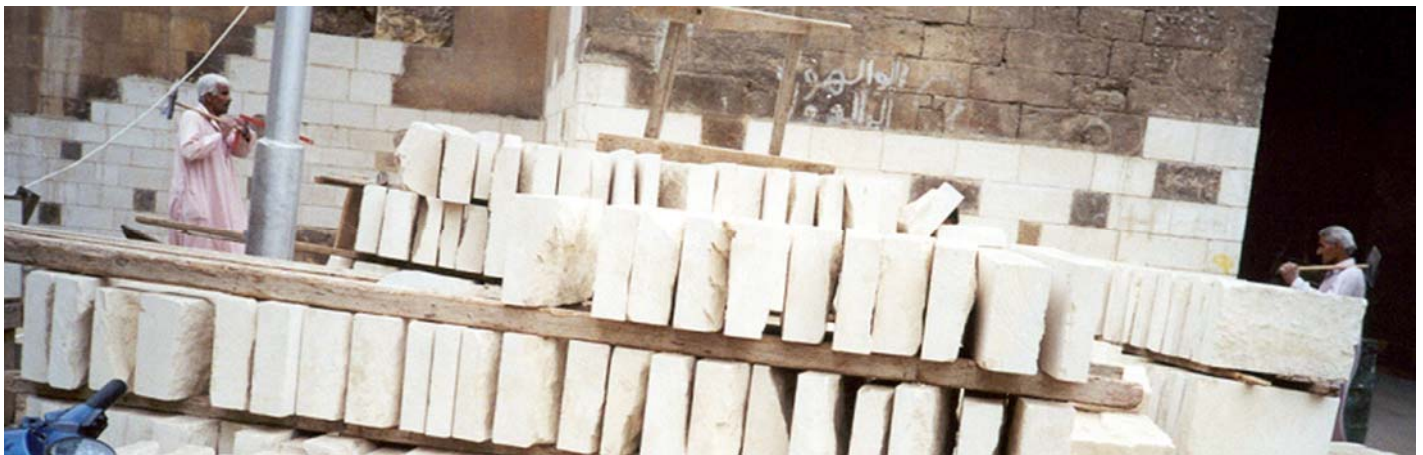
Figura 3. Desbaste final da pedra feito de forma tradicional na recuperação de um monumento no Cairo, Egito.

É pois possível, como aliás sempre aconteceu, não ser limitado pelos limites do preconceito em relação à tradição, conhecer os limites da contemporaneidade e preservar o conhecimento construtivo material e imaterial de que o patrimônio arquitetônico é testemunho.