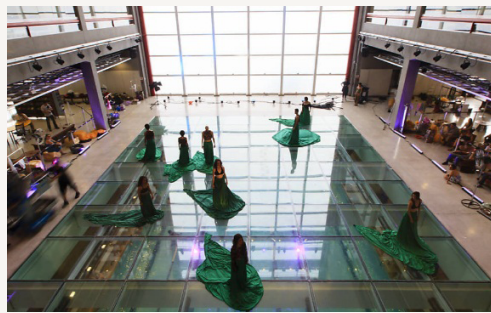
Espectadores assistindo Claraboia (2013) do mesmo nível dos bailarinos.

Esses exemplos ressaltam que o desejo de se aproximar do público tem se tornado parte da concepção da obra. Muitas vezes, o projeto em si já tem no espectador um elemento constitutivo para a criação da cena. Outras vezes, a participação do público vai