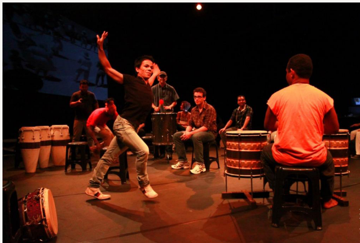
Projeto Baderna (2011), de Luis Ferron.

6 Artista da dança (São Paulo – SP), diretor e coreógrafo do núcleo artístico Luis Ferron. Entre seus trabalhos recentes estão: Sapatos Brancos (Prêmio APCA 2009 e Prêmio BRAVO 2010 de melhor espetáculo) e Baderna (Prêmio APCA 2012 de melhor espetáculo).