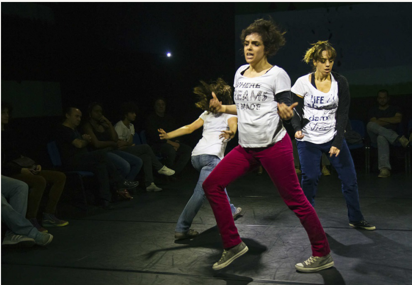
Fleshdance 2 (2012), de Adriana Grechi.

Adriana costuma provocar o deslocamento do olhar do espectador pelas várias opções de disposição do público. Em alguns dos seus últimos trabalhos, colocou as cadeiras em círculo e, por vezes, as bailarinas transitavam por trás delas, de modo que precisávamos nos repositonar para acompanhá-las. Também já optou por deixar as cadeiras umas de frente para as outras, separadas pela cena. Em ambos os casos a mesma projeção de vídeo passava em mais de uma parede, podendo ser vista sob vários ângulos.