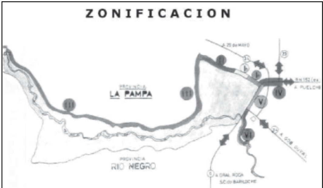
Fig. 4 - Villa Casa de Piedra. Referencias: