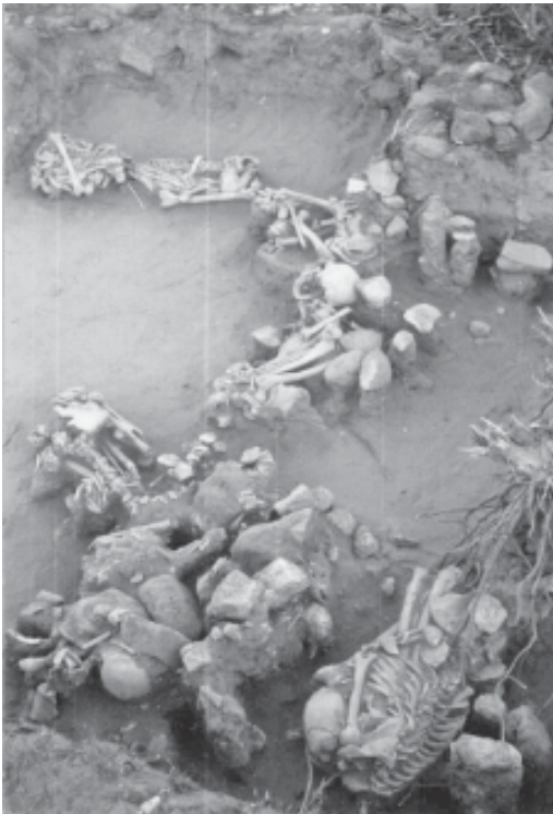
Fig. 8 - Enterratorios del sitio Chenque I.

Los efectos de las Grandes Obras tienen un impacto no sólo local sino regional y además se prolongan en el tiempo (Radovich 2003). Un proyecto de desarrollo de gran magnitud como el mencionado en Casa de Piedra, debería plantearse indicadores de impacto que permitan evaluar las consecuencias (tanto negativas como positivas) que resulten de esas acciones. En este sentido, creemos necesaria la definición de indicadores de impacto para las localidades vecinas a la Villa Casa de Piedra y, en este caso particular,