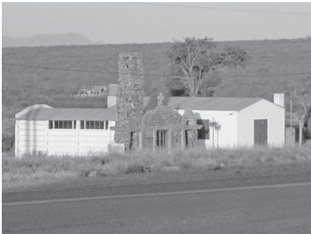
Fig. 7 - A la izquierda, local del Museo de la localidad, a la derecha, taller de artesanos.

económicas y sociales que caracterizó a esa época, desde los primeros colonizadores. Se pretende rescatar el conocimiento de los antiguos pobladores del área rural y/o de sus descendientes, así como el sistema de ideas y valores recreado en torno a los sitios prehispánicos. Entre los objetivos se incluye comparar la información arqueológica del proceso de colonización con los datos contenidos en los documentos históricos, crónicas y registros de la época y rescatar la historia regional a partir de entrevistas a las viejas familias y pobladores de la zona. Con este propósito se ha incorporado al equipo de investigación un estudiante avanzado de Antropología Social y por otra parte se ha conformado un grupo de investigación de la historia local a instancia del Instituto de Estudios Sociohistóricos de Facultad de Ciencias