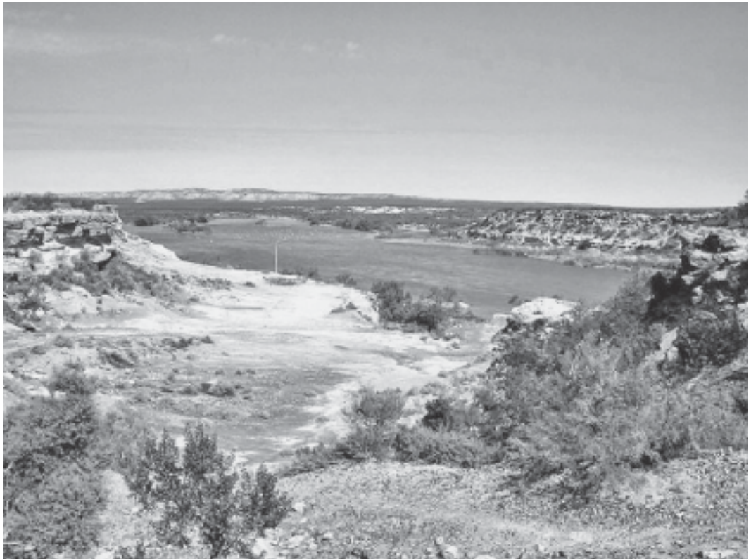
Fig. 2 - Bardas y terrazas sobre el Río Colorado.

En la segunda etapa, el sector privado comenzará a realizar sus inversiones en los servicios planificados según el proyecto: hoteles, canchas y zonas deportivas, un club náutico, venta de productos y comidas regionales, estación de servicio, parador de camiones y micros, restaurante, área comercial, camping, etc. La inversión pública incluirá además un balneario, miradores, centro de salud, destacamento policial, escuela