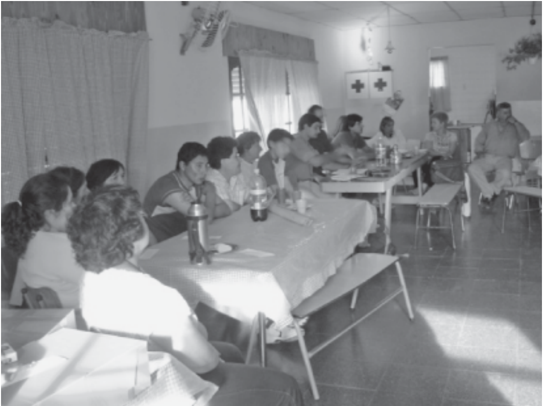
Fig. 5 - Talleres de Evaluación