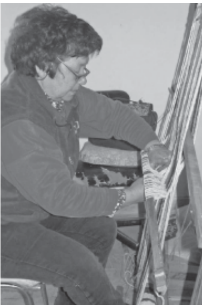
Fig. 6 - Artesana tejiendo en telar vertical.

5. Acondicionamiento de la antigua capilla para instalación de un museo de la localidad: