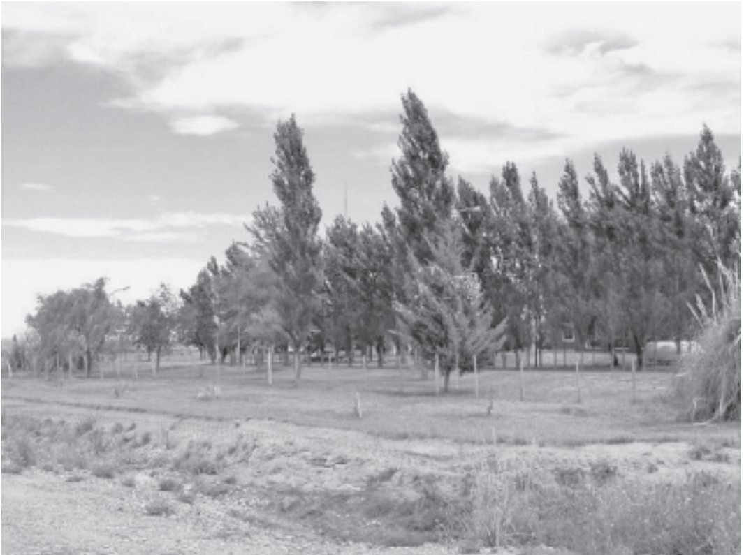
Fig. 3 - Parquización en el entorno de la Villa.