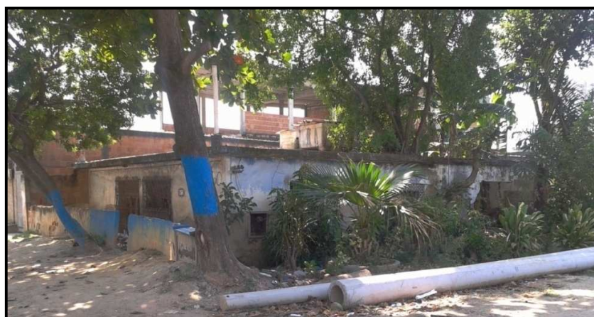
Figura 1. Frente da antiga residência de Joãozinho da Gomeia.