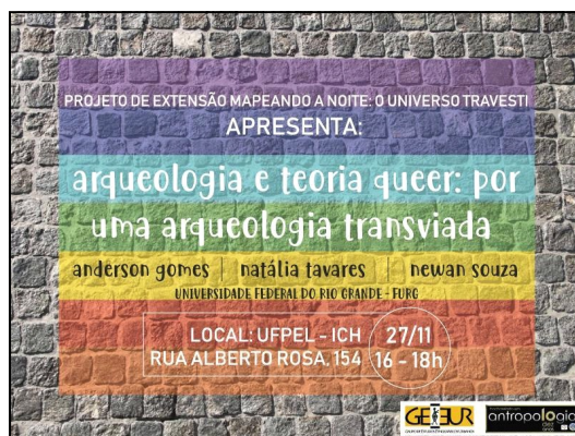
Figura 2. Arte de divulgação da segunda edição da oficina, realizada na Universidade Federal de Pelotas, com a apoio do GEEUR

Não tivemos um roteiro claro e objetivo, mas para nossos propósitos, o de incomodar e escutar mais do que falar, esse formato rendeu frutos, aproximação e debates que, pessoalmente, nos marcaram como indivíduos e futuros cientistas. O propósito da oficina, em linhas gerais, fora alcançado porque criou um espaço em que nossas discussões foram embasadas pelo âmago das subjetividades dos indivíduos e do que são as ciências humanas, e não uma discussão de métodos e números por si só, nos entregamos enquanto sujeitos sensíveis e propomos isso em troca aos participantes.