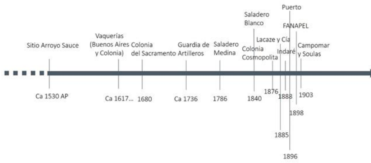
Figura 2. Esquema del proceso histórico del área.