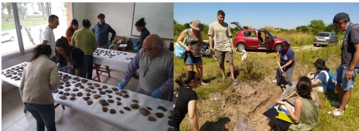
Figura 3. Integrantes del ELAI realizando tareas de laboratorio y de campo: a- análisis primario de tiestos cerámicos de la Colección Mora procedentes de la ensenada del Sauce. b- búsqueda de fuentes de arcilla local y extracción.