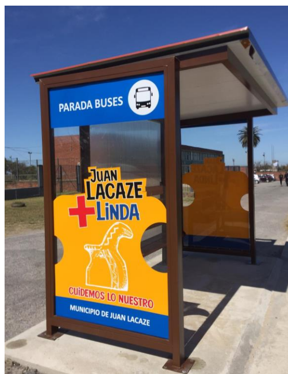
Figura 4. Nuevas paradas de buses de Juan Lacaze, colocadas en 2020. Incluyen imagen vectorizada de una “campana zoomorfa”, pieza arqueológica de Arroyo Sauce.

producción, eligieron la imagen de una pieza arqueológica como uno de estos mojones en la historia local, específicamente la de una “campana zoomorfa” como marca identidad. Por parte desde el Municipio también se llevó a cabo la instalación de paradas de buses que incluyen otra de estas piezas con diseños vectorizados (Figura 4). A estos casos se suma el proyecto gráfico de un particular de vectorización de diseños cerámicos locales para diferentes usos comerciales, artísticos y didácticos.