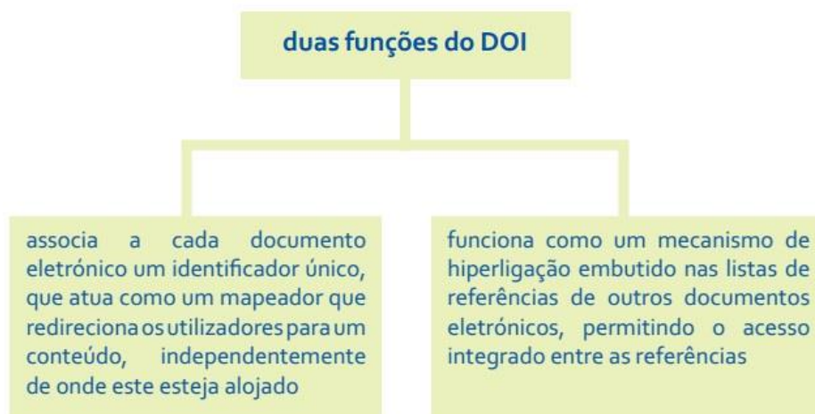
Figura 2 - Funções do DOI.