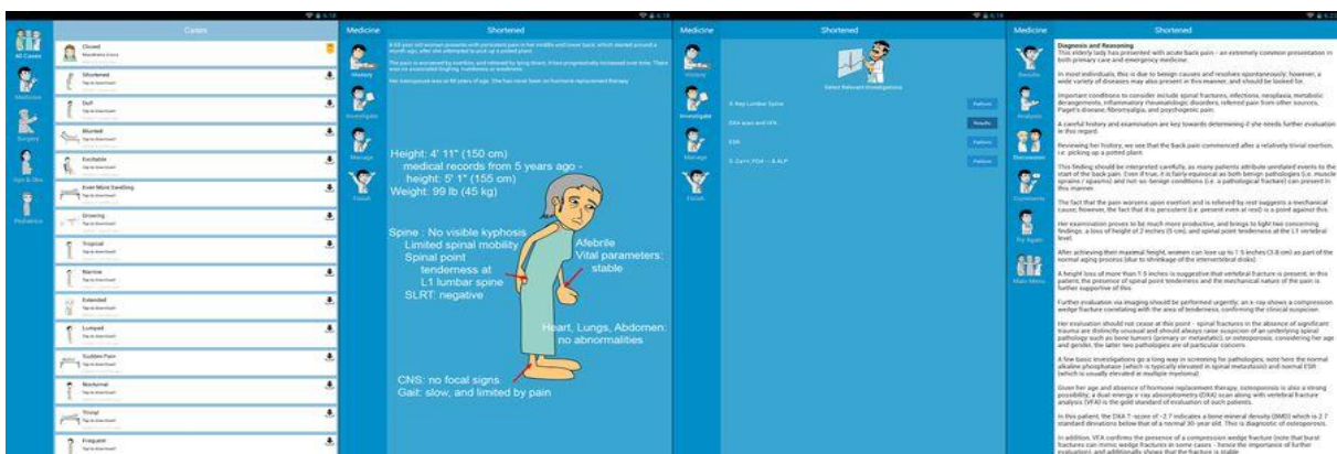
Figura 2. Telas do Prognosis: Your Diagnosis