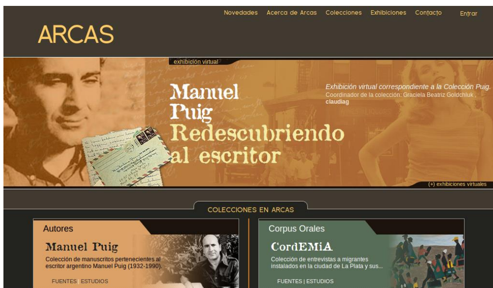
Figura 2. Página de inicio de ARCAS