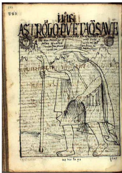
Figura 3: O filósofo indígena Juan Yunpa. Ponte: Poma de Ayala (1615, p. 897).

Ao fundo da imagem, podemos ver a cordilheira, o sol e a lua. Juan Yunpa caminha ereto com seu cajado e seu chapéu. A legenda diz: “Astrólogo Poeta que sabe do giro do sol e da lua e eclipse e de estrelas e cometas, reza, domingo e mês e ano e pelos quatro ventos do mundo para semear a comida. Desde antigamente” (POMA DE AYALA, 1615, p. 897). Aqui, o astrólogo-poeta é aquele que sabe ler o cosmo e sabe ler o quipu , mas também aquele para o qual a cosmologia é o vínculo com a poesia – poesia no sentido da etimologia grega, do fazer, da criação de mundos. O cosmo é o meio para o fazer e o fazer passa pelo saber, pelo fato de ele saber que sabe e mobilizar esse saber para continuar semeando o sustento do seu mundo. Ele ora aos domingos, mas também para os quatro ventos. Juan Yumpa é guardião do calendário agrícola – incluído ao final de seu texto –, este que, embora subordinado ao calendário gregoriano, fundamenta-se sobre as práticas milenares de plantio. Na introdução ao calendário, Waman Poma alerta sobre como a violência sobre as comunidades implica a perda de cultivos e sementes, sem as quais inclusive os funcionários do reino ficam sem comer, já que comem, como diz, “às custas dos pobres índios” (POMA DE AYALA, 1615, p. 1.140). Escreve Cusicanqui: