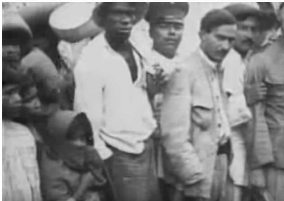
Figura 5: Foto do velório de Emiliano Zapata em Cuautla, México.