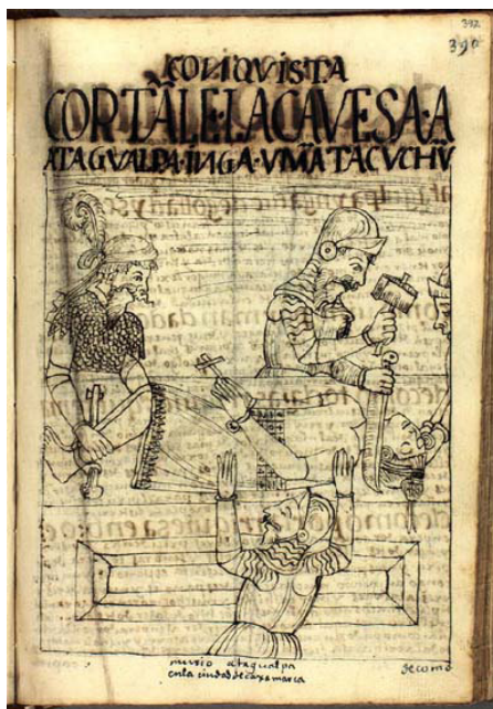
Figura 1: Decapitação de Atawalpa. Fonte: Poma de Ayala (1615, p. 392).