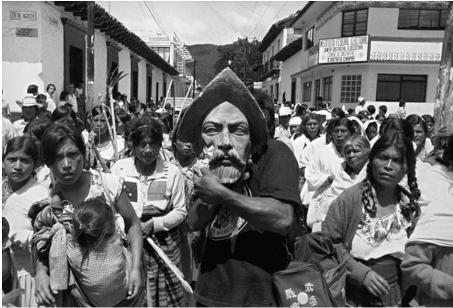
Figura 4: Multidão em San Cristóbal de las Casas, carregando a cabeça decepada da estátua de Diego de Mazariegos.