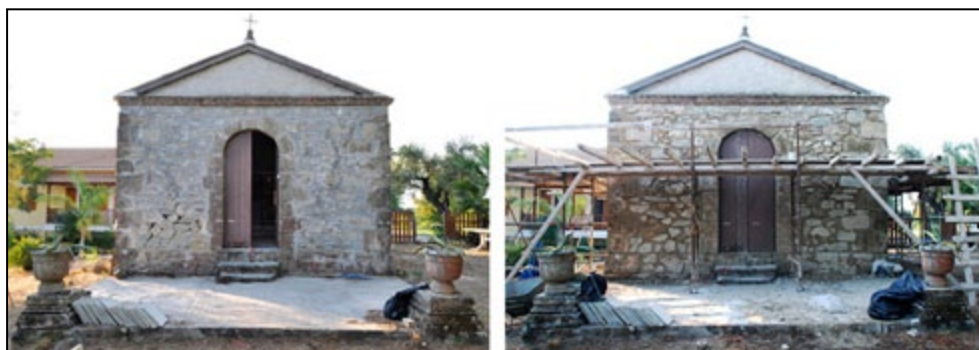
Figura 1 – A capela familiar Panagia Vlaherna, antes e durante os trabalhos do workshop. Fotos do autor, 2011.

A metodologia de trabalho do evento relacionava estudos que implicavam