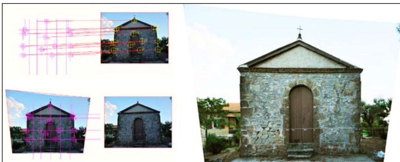
Figura 3 - Processo de retificação fotográfica com uso de sistemas computacionais simples (no caso, plugin PhotoPlan para AutoCAD). Fotos e desenhos do autor. Acervo Diadrisis, 2011.

muitas e isso explica sua popularidade atual, especialmente na produção de mosaicos ortofotográficos, que remetem às tradicionais documentações fotográficas por montagem panorâmica em projetos de conservação. Além da redução de tempo na documentação do objeto, podem ser aplicadas em casos de emergência ou de tempo reduzido. Ainda, quando combinada ao desenho à mão in situ , realizado em adequada representação escalar, tornam-se fontes complementares de suporte ao projeto de conservação, e assumem, pela natureza do registro fotográfico, um importante significado expressivo (SANPAOLESI, 1980: 66).