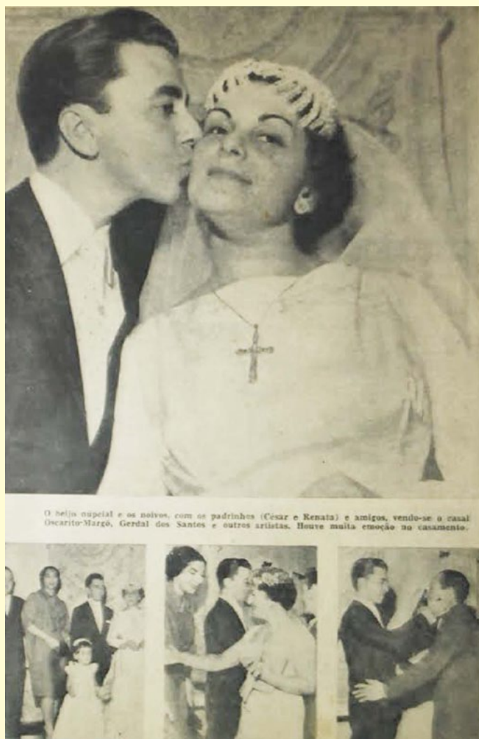
Cena do casamento: fotografia particular e página da Revista do Rádio