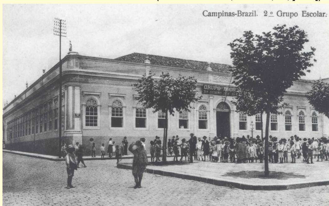
FIGURA 2 – ANTIGO SOLAR DOS ARANHA (2º GRUPO ESCOLAR, CAMPINAS, SP, [1923]).