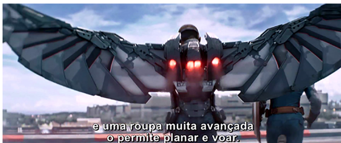
Imagem 3 – Falcão.