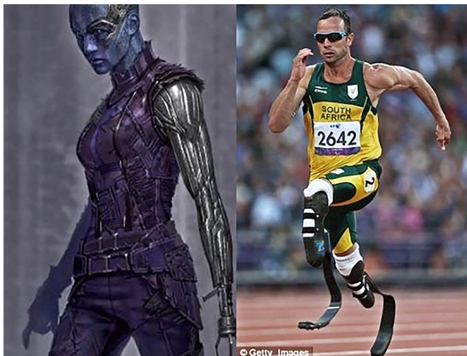
Imagem 1 – Nebulosa e Oscar Pistorius.