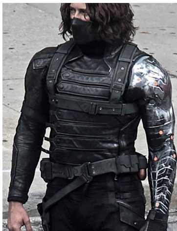
Imagem 2 – Soldado Invernal.

No filme Capitão América: guerra civil , uma boa parte do enredo é centrada no soldado Invernal, retomando sua história e esmiuçando, em detalhes, sua criação. Na produção cinematográfica é possível observarmos que o personagem também foi exposto a um soro semelhante ao do capitão Rogers, mostrado em 1h13min da produção (CAPITÃO AMÉRICA, 2016). A película aponta também que Barnes é acionado a partir de