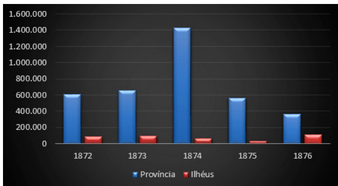
Gráfico 2 – Exportações de cachaça em litros (Bahia, 1872-1876).

Fonte: Center for Research Libraries (1878); Ilhéus (1878a).