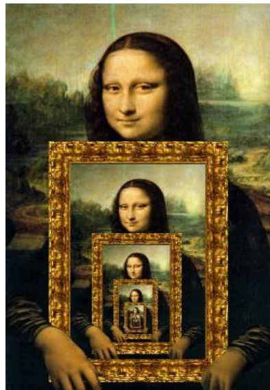
Figura – Mona lisa 6