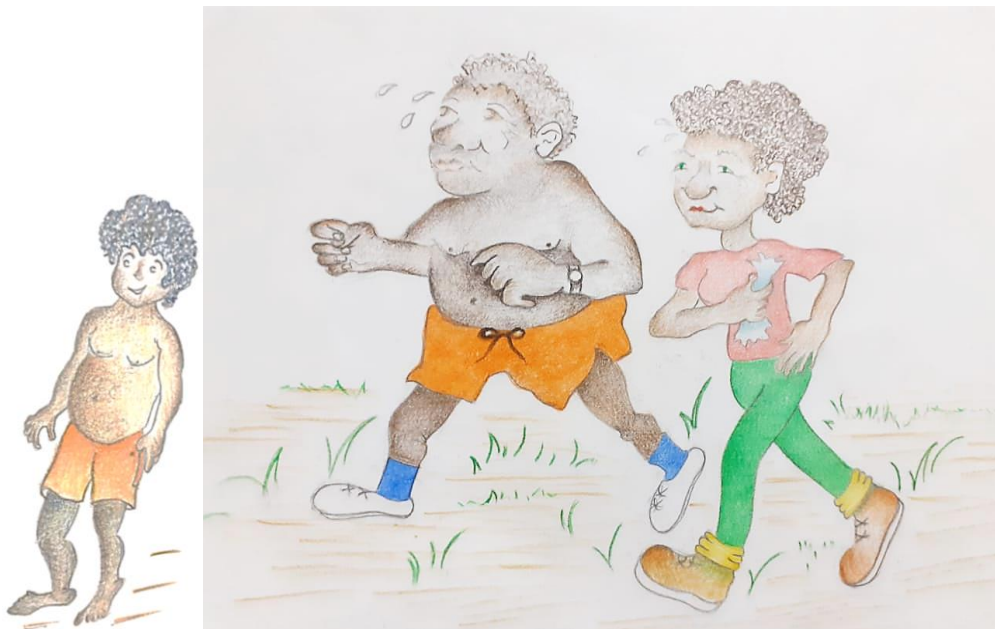
Figura 2. Ilustração da história – Dito e seus avós

Fonte: História “As aventuras de Dito em busca da comida de verdade”, 2022.