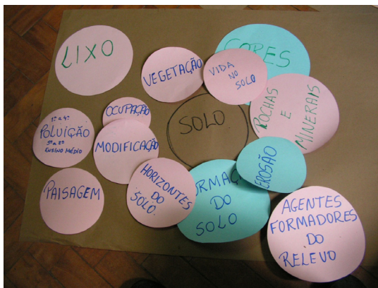
Figura 1. Aspecto do Diagrama de Venn construído pelo grupo que participou do curso de capacitação do ano de 2004

Foram construídos três diagramas de Venn (Figura 1), onde foi possível perceber a influência das oficinas dos cursos no conjunto amplo e diversificado de conteúdos mais ou menos relacionados