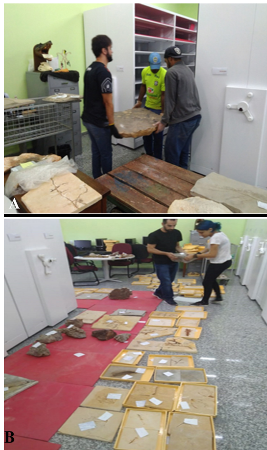
Figura 2. Manejo do acervo da Coleção de Macrofósseis da Universidade Federal do Rio de Janeiro. (A). Formas de manejo dos espécimes tombados na coleção; (B). Reorganização física do acervo, com agrupamento por níveis taxonômicos

A partir da incorporação do fóssil a uma coleção, a sua deterioração tem quase sempre uma direta relação com a natureza da matriz rochosa em que está inserido, ou com sua composição mineralógica. Climas quentes e úmidos são extremamente agressivos, pois aceleram as reações químicas e facilitam a colonização de superfícies expostas por fungos. Desta forma, materiais carbonáticos são muito susceptíveis à agressão por soluções ácidas. Poeira e poluentes são geralmente os grandes responsáveis por fenômenos corrosivos, daí a importância