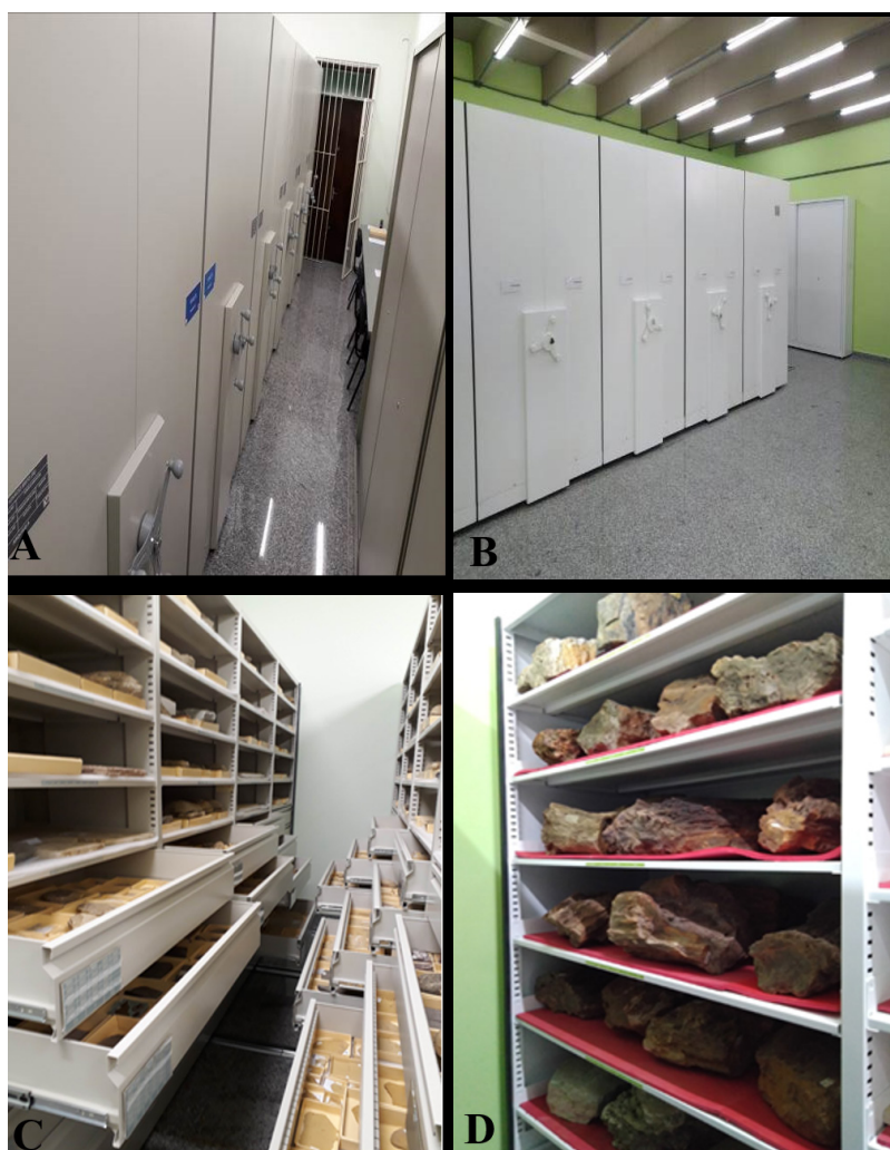
Figura 3. Novo espaço do acervo Coleção de Macrofósseis da Universidade Federal do Rio de Janeiro, revitalizado com base nos conceitos de conservação preventiva: novas salas para reserva técnica (A, B), e acondicionamento adequado em compactadores de aço, com gavetas (C) e prateleiras (D)

O objeto de coleção / museu, além de ser carregado de significados e informações, também é