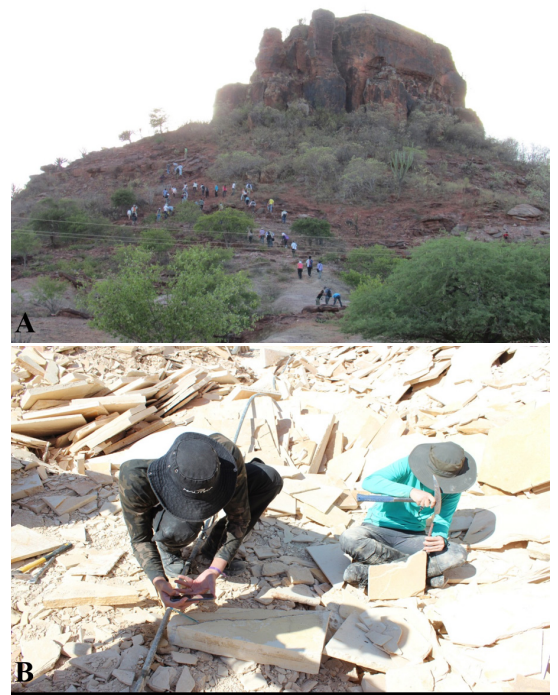
Figura 1. O acervo da Coleção de Macrofósseis se constituiu por meio de coleta sistemática realizada por docentes e discentes dos cursos de graduação e pós-graduação em Geociências e Biociências da Universidade Federal do Rio de Janeiro. (A). Atividade de campo na Formação Pimenteiras, Bacia do Parnaíba, Estado do Piauí, em que discentes dos cursos de graduação da UFRJ são treinados na coleta de fósseis; (B). Na Formação Santana, Bacia do Araripe (Estado do Ceará), a coleta de fósseis é realizada seguindo técnicas tradicionais em lavras de calcário

Destaca-se, no acervo, um grande número de fósseis procedentes das bacias do Araripe, Bauru, São Luís, São José de Itaboraí, Paraná, Parnaíba, Resende, Sousa, Sanfranciscana, São José de Belmonte, Taubaté e Potiguar. Deste acervo fazem parte materiais de extrema importância, como os holótipos (tipo