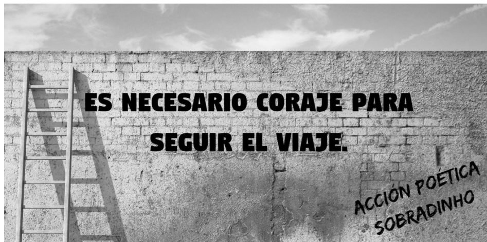
Figura 5. Evento discursivo 2 (educador(a) em formação B)