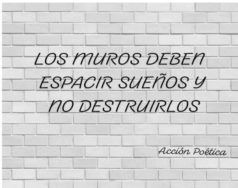
Figura 4. Evento discursivo 1 (Educador(a) em formação A)