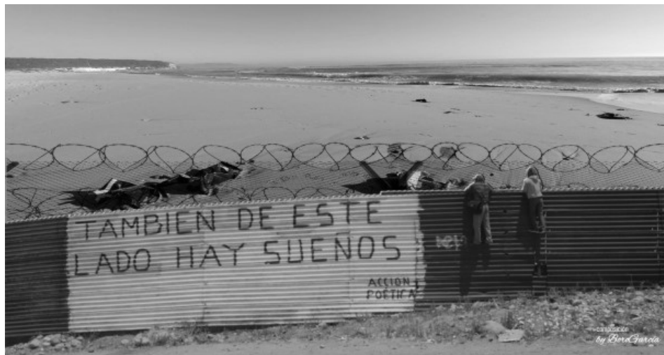
Figura 3. Mural "También de este lado hay sueños".