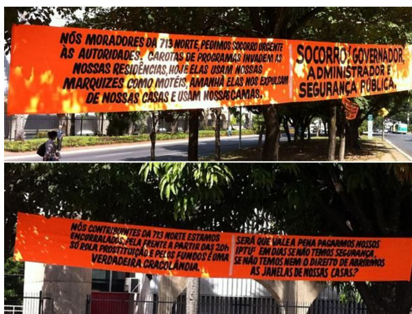
Figura 2: Faixas de moradores protestando contra a prostituição. Fonte:

visão diário” o comércio sexual (RODRIGUES, 2003: 32), ou seja, estabelecer fronteiras sexuais com respectivos campos visuais que delimitem as paisagens sócio-sexuais da cidade a as identidades relacionadas.