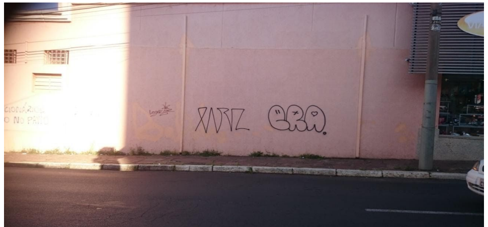
Figura 2: Centro Histórico de Araraquara.