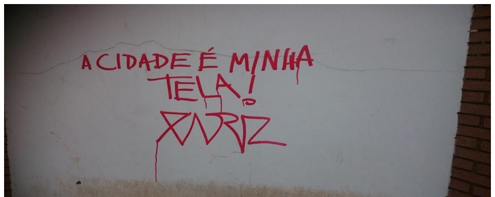
Figura 3: Centro Histórico de Araraquara.