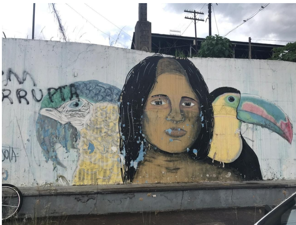
Figura 5: Grafite do projeto “Espaço da Arte” - Centro Histórico de Araraquara Fonte: Acervo Próprio. 2018.

O importante é ponderarmos que estes eventos trazem novas perspectivas aos espaços antes abandonados ou com uso restrito, e isso leva a cidade a uma nova forma de desenvolvimento, aquele que está relacionado ao aprimoramento das condições de vida dos indivíduos nas cidades. O fato de jovens, adultos e crianças se reunirem para organizar e viver a cidade é extremamente importante, já que as pessoas passam a participar das dinâmicas da cidade, interessando-se pelos aspectos que permeiam o ambiente social onde vivem.