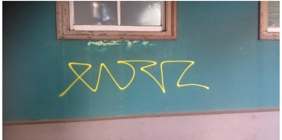
Figura 1: Centro Histórico de Araraquara.