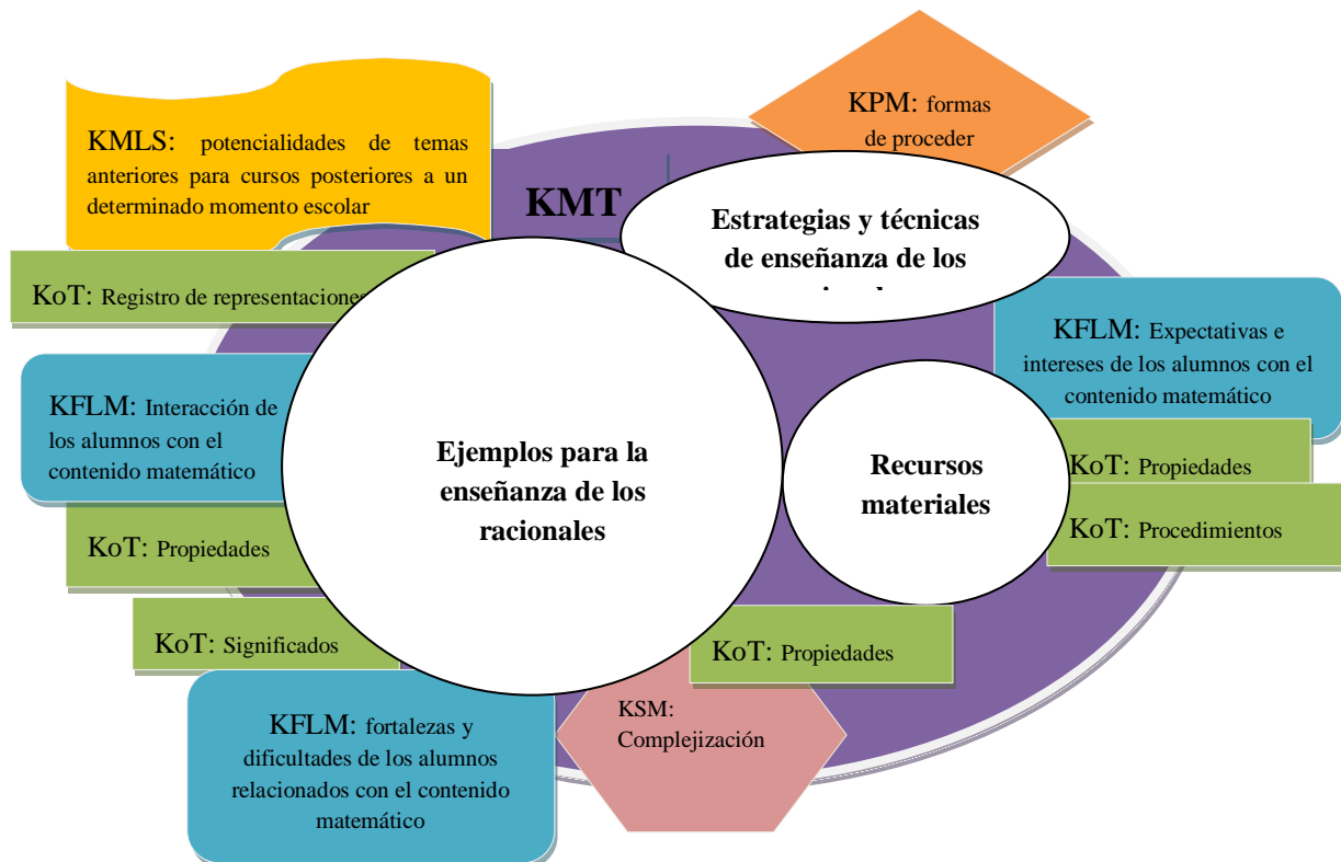
Figura 3. Mapa de conexiones entre el KMT de Ana y otros subdominios del modelo MTSK.

DOI: http://dx.doi.org/10.20396/zet.v24i3.8648095