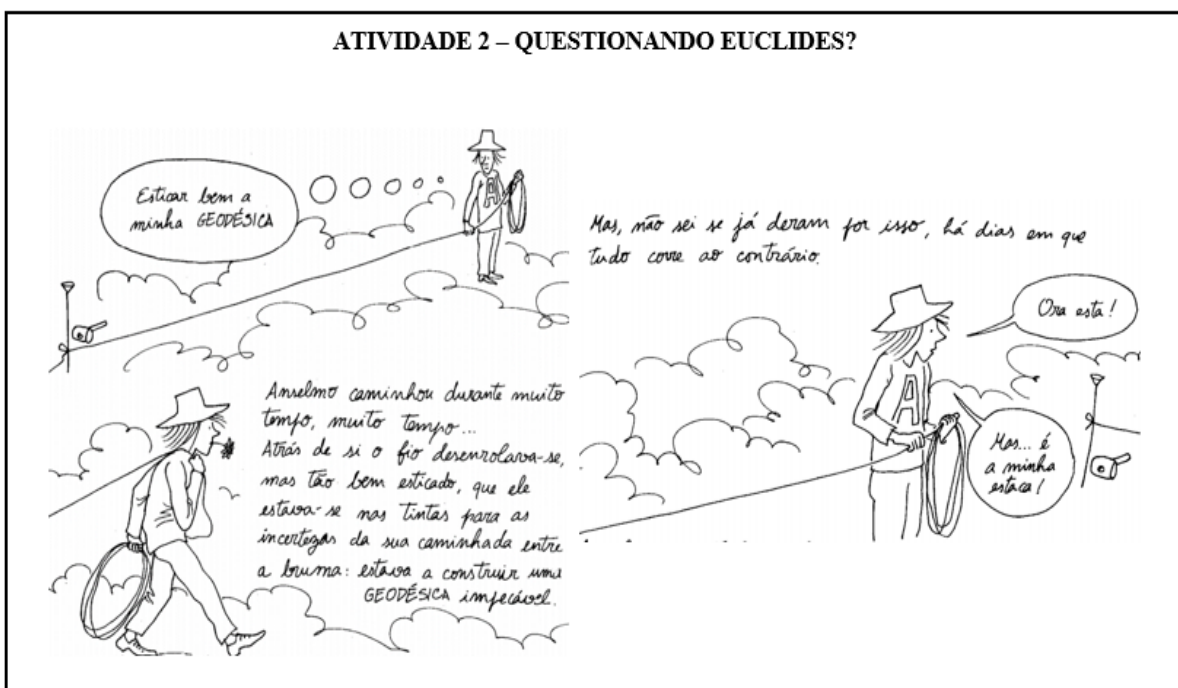
Figura: Material adaptado de “As aventuras de Anselmo curioso: os mistérios da Geometria”